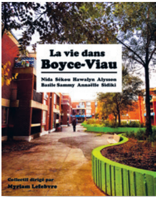
Le recueil des enfants La vie dans Boyce-Viau est disponible et distribué gratuitement sur demande.

Au moment de donner un titre à ce recueil, j'ai demandé aux enfants quelles étaient leurs idées. Spontanément, ce sont des titres en lien avec leur milieu qu'ils m'ont donnés.