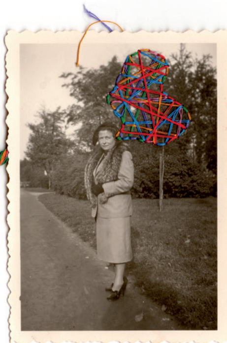
Tangled 1, 20 x 35 po, 2017.