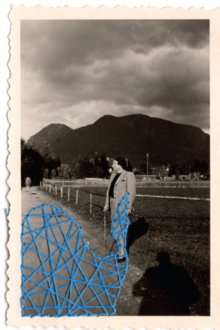
Tangled 2, 20 x 35 po, 2017.