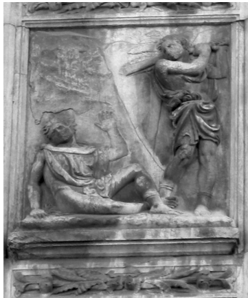
Jacopo della Quercia, J. della, Caïn tuant Abel , bas relief, portail central de la cathédrale de San Petronio, Bologne.

Les figures puissantes de Jacopo della Quercia (v. 1371-1438), qu'on retrouve sur les dix panneaux de marbre qui ornent le portail central de la cathédrale San Petronio de Bologne, sont inspirées à la fois par une riche tradition gothique (plus particulièrement par la sculpture pisane), mais aussi par la redécouverte des modèles classiques. Les bas-reliefs illustrent l'histoire d'Adam et Ève et de Caïn et Abel. Certains motifs évoquent tout particulièrement la décoration des sarcophages romains. En célébrant la beauté des corps, on vise à affirmer la noblesse des créatures de Dieu. La part d'inspiration venue de l'Antiquité témoigne de ce désir qu'avaient les hommes de la Renaissance de réconcilier héritage classique et tradition chrétienne.