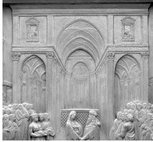
Lorenzo Ghiberti (1378-1455), La Rencontre de Salomon et de la reine de Saba, la porte du Paradis (1425-1452), Bronze doré, 79,5 x 79,5 cm, 1425-1437, Museo dell'Opera del Duomo, Florence.

le supérieur général de l'ordre des Camaldules, y joua un rôle de premier plan. C'est peut-être lui qui aurait fait en sorte que l'on substitue au « Jugement de Salomon » la « Rencontre de Salomon avec la reine de Saba », dirigeant ainsi les exégètes vers une autre lecture mettant en valeur le rôle de Florence dans cette grande entreprise de rapprochement 16 .