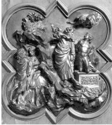
Lorenzo Ghiberti, Le sacrifice d'Abraham , bronze doré, 53,3 x 44,5 cm, Museo Nazionale (Bargello), Florence. Image libre de droits sur :

on l'aurait laissé libre de déterminer à sa guise le programme et le style de cette troisième porte. C'est lui qui aurait décidé de réduire à dix le nombre des compartiments 14 .