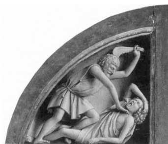
Jan van Eyck (v. 1385-1441), Le retable de l'Adoration de l'Agneau mystique, 1426-1432, cathédrale Saint-Bavon, Gand. Détail de la face intérieure du polyptyque: le Meurtre d'Abel.

Revenons à Alberti (1975; nous traduisons) :