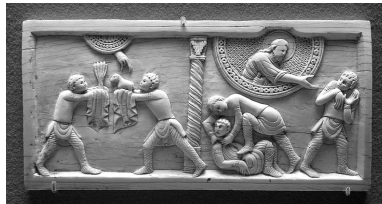
Le Sacrifice de Caïn et Abel; le meurtre d'Abel , ivoire, 10,9 x 22,1 cm. Plaque provenant d'un ensemble (devant d'autel ?), très probablement réalisé pour la nouvelle cathédrale de Salerne, fondée par Robert Guiscard et consacrée en 1084. Paris, Musée du Louvre.

Avec l'histoire de Caïn et Abel, on atteint en quelque sorte le point limite. Alain Gignac, dans son article, souligne l'aspect extrêmement elliptique du meurtre, dans la Genèse : il n'est pas décrit, relaté dans le détail, mais simplement énoncé sans la moindre information qui permette de s'en figurer les modalités. Aux artistes donc (et à leurs conseillers) d'imaginer les conditions concrètes du fratricide : mains nues, pierre, mâchoire d'animal 4 , bâton, couteau 5 .