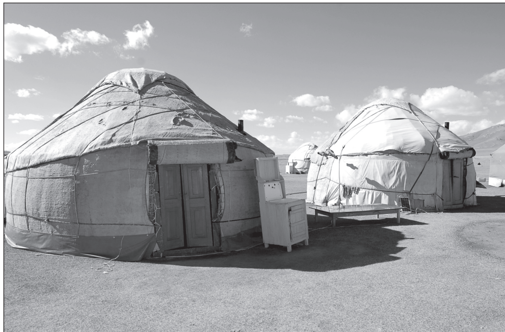
ILLUSTRATION 2 : Lavabo et panneau solaire autour des yourtes, Song Köl, Kirghizstan. (photo : Johanne Pabion Mouriès).

en créant près de 2 000 emplois pour les femmes. Elle a ainsi reçu le prix de Women's creativity in rural life 2005, délivré par la Fondation du Sommet mondial des femmes (Women's World Summit Fondation). Considérée comme la meilleure entrepreneuse en milieu rural, ayant mis en place «le tourisme nomade et le développement durable» (WWSF, 2011), Mairam s'est vue récompensée par un don de 500 dollars, une photographie dans la presse locale et un article dans un journal diffusé à l'échelle internationale.