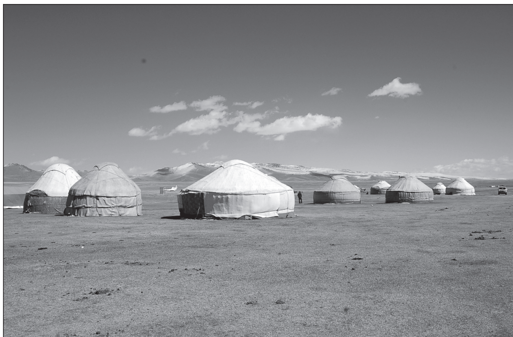
ILLUSTRATION 3 : Campement de yourtes de Bataï Aral.

cas de deux mois conduite en 2007 a été complétée en septembre 2012. Les données recueillies en 2007, notamment sur les trajectoires historiques, sociales et géographiques comme sur les caractéristiques des familles (nombre de bétail, de yourtes à disposition, de touristes accueillis, salaire perçu, ONG d'appartenance, etc.), ont ainsi pu être réactualisées cinq années plus tard.