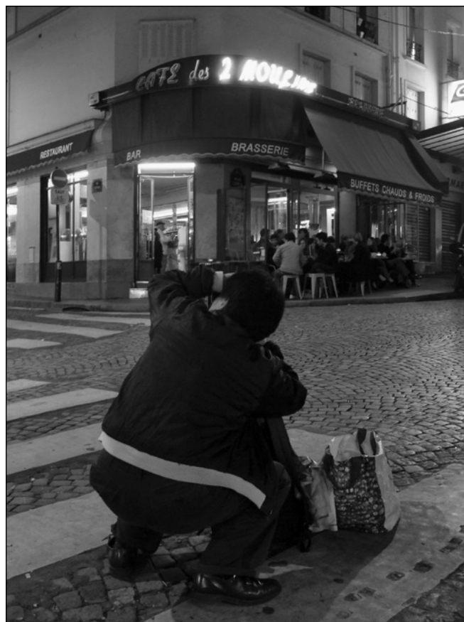
ILLUSTRATION 3 : Un touriste en train de photographier la devanture du café des 2 Moulins.

Dans la vitrine des toilettes du café des 2 Moulins, les polaroids du nain de jardin et la lampe de chevet de Collignon construisent un rapport indiciel au film. Ils semblent en avoir été arrachés pour se voir exposés. On pourra rétorquer qu'ils sont possiblement faux. Quand bien même ce serait le cas, ces copies seraient à ce point conformes aux originaux qu'elles n'en cesseraient pas moins de se donner comme appartenant à l'univers du film. Les nains de jardin définissent, quant à eux, un rapport iconique au film. Leur morphologie n'est pas celle du héros voyageur farceur qu'on y rencontre. Aucun d'entre eux n'a donc pu être arraché au film. Toutefois, la dynamique de coprésence de plusieurs de ces petits êtres permet d'instituer une relation de ressemblance ou d'analogie avec le nain