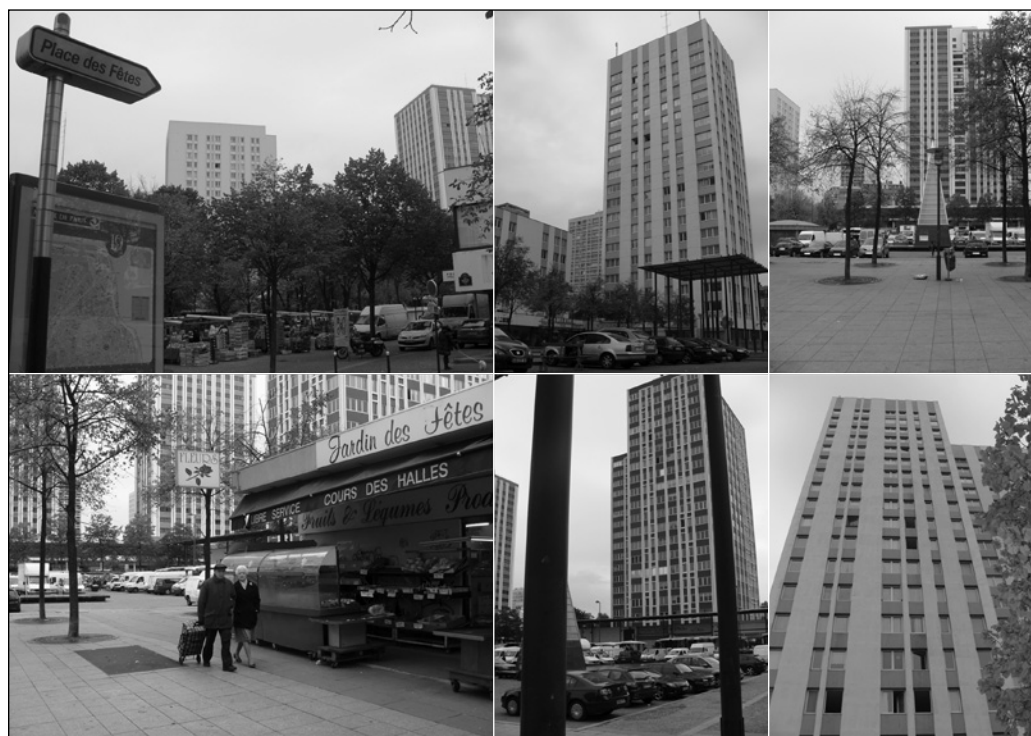
ILLUSTRATION 1 : Vues de la Place des Fêtes.

compose de cinq pages. La première page de couverture donne à voir l'affiche du film et les logos institutionnels de la mairie de Paris ainsi que le slogan « Découvrez les lieux de tournage. Discover where the film was shot ». La deuxième page du document expose le projet global des parcours cinéma puis présente le film succinctement : « Raconter en cinq minutes l'histoire d'une rencontre amoureuse dans un quartier de Paris, tel est le défi qu'ont accepté de relever, avec Paris, je t'aime , vingt et un réalisateurs venus du monde entier » (mairie de Paris, 2010 : 2). La troisième page s'organise autour d'un schéma réduit de Paris segmenté en arrondissements. Sur ce plan sont distribués les points de localisation des lieux de tournage des différents courts métrages composant le film. Six d'entre eux font enfin l'objet d'une attention spécifique en pages 4 et 5. Il s'agit de la Place des fêtes, du Faubourg Saint-Denis, de Bastille, de la Place des Victoires, du Quais de Seine et du 14 e arrondissement (à ce propos, on remarquera que c'est la diversité des types de lieux représentés qui a été privilégiée : il peut s'agir d'une place, d'un quartier, voire d'un arrondissement).