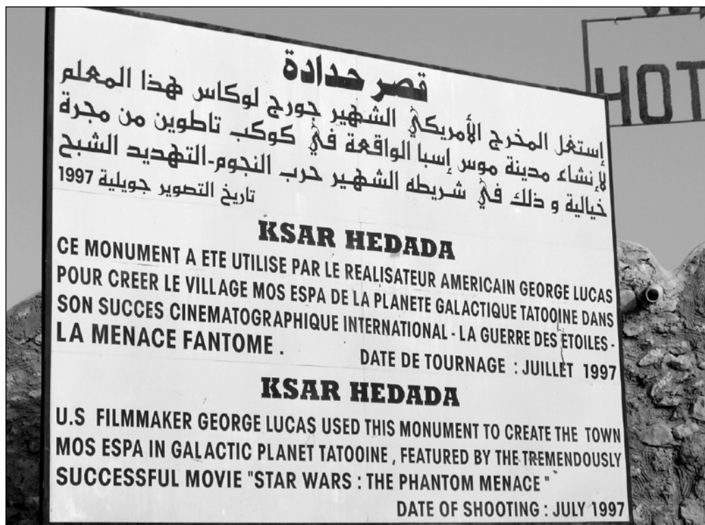
ILLUSTRATION 3 : Panneau à l'entrée de Ksar Hadada.

il constitue un fragment d'un lieu qui donne sens à ce lieu tout entier : ainsi, en visitant Ksar Hadada, on visite le Sud tunisien, tout comme on visite San Francisco en se rendant, symboliquement, sur le Golden Gate Bridge, pour reprendre l'exemple de MacCannell. Il s'agit cependant d'un marqueur original, car autant un marqueur de l'espace « réel » (le désert du Sud tunisien) qu'un élément d'un espace imaginaire, la planète Tatouïne.