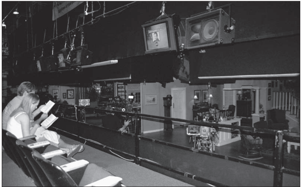
ILLUSTRATION 2 : Le tournage d'émissions devant public par les studios favorise le ciné-tourisme en encourageant les fans à visiter les lieux d'enregistrement, comme ici en Californie pour une comédie de situation populaire.

club, une participation à des conventions de fans, la création de produits dérivés — fanzine, notamment — ou encore le déplacement vers des sites qui lui sont associés). On comprendra que l'intérêt des plus actifs s'organise autour de la reconnaissance par un groupe d'individus d'un intérêt spécifique pour une production. Plus la production est populaire, plus elle pourra contribuer au déplacement d'un nombre important de fans. (Soulignons cependant que des productions reconnues par des publics plus restreints ou hyper spécialisés sont aussi l'objet de ciné-tourisme, non organisé et souvent de manière improvisée, voire underground .)