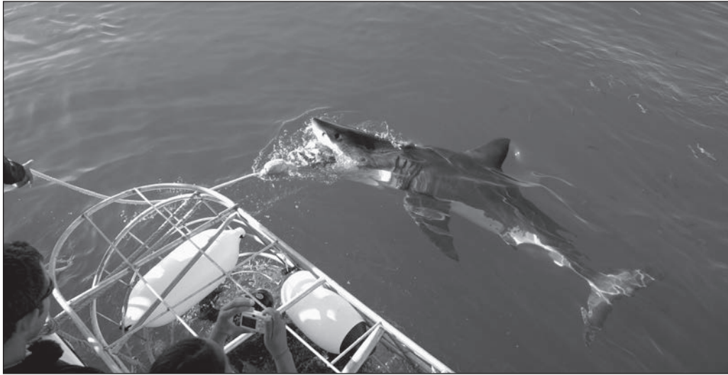
ILLUSTRATION 5 : La réputation de tueur du requin blanc fait désormais courir les touristes, comme ici en Afrique du Sud.

piscivores) engendrée par le film a non seulement contribué à l'édification de l'image de tueur associée aux requins mais à la menace même de la survie de certaines espèces. Du même coup, le film a par ricochet aidé au développement du tourisme d'excursions aux requins (voir illustration 5).