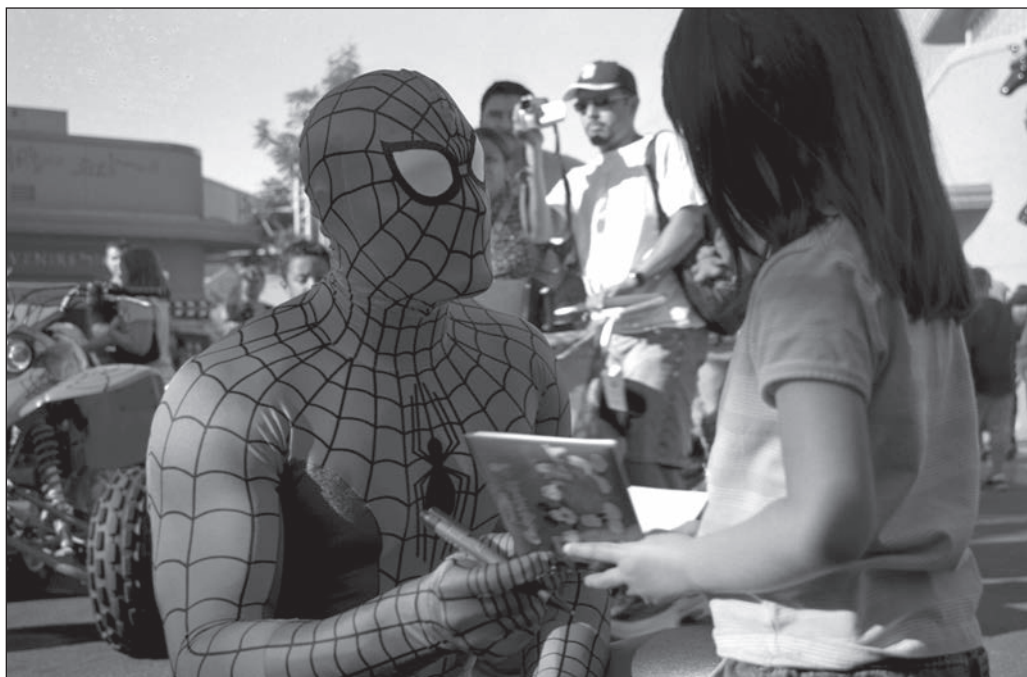
ILLUSTRATION 3 : La collection d'autographes est l'une des activités les plus populaires des fans, tous âges confondus.

vidéo-magnétiques au début des années 1980) facilitent l'accès du public (et des fans) aux productions et multiplient les heures possibles de visionnement (et d'analyse) des productions chéries. L'arrivée de l'Internet, dans les années 1990, permettra à nombre de fans, souvent isolés, de sortir ainsi de leur « placard » pour vivre et partager l'objet de leur passion avec les pairs. Enfin, la poussée et la démocratisation de l'informatique, avec l'arrivée des logiciels domestiques de montage, octroieront une liberté quasi complète aux fans désormais capables de s'immiscer dans leurs productions préférées par des activités de « fanzine » (la production de périodiques ou d'apériodiques mais aussi de remontage vidéo ou de productions satiriques) à partir des films cultes.