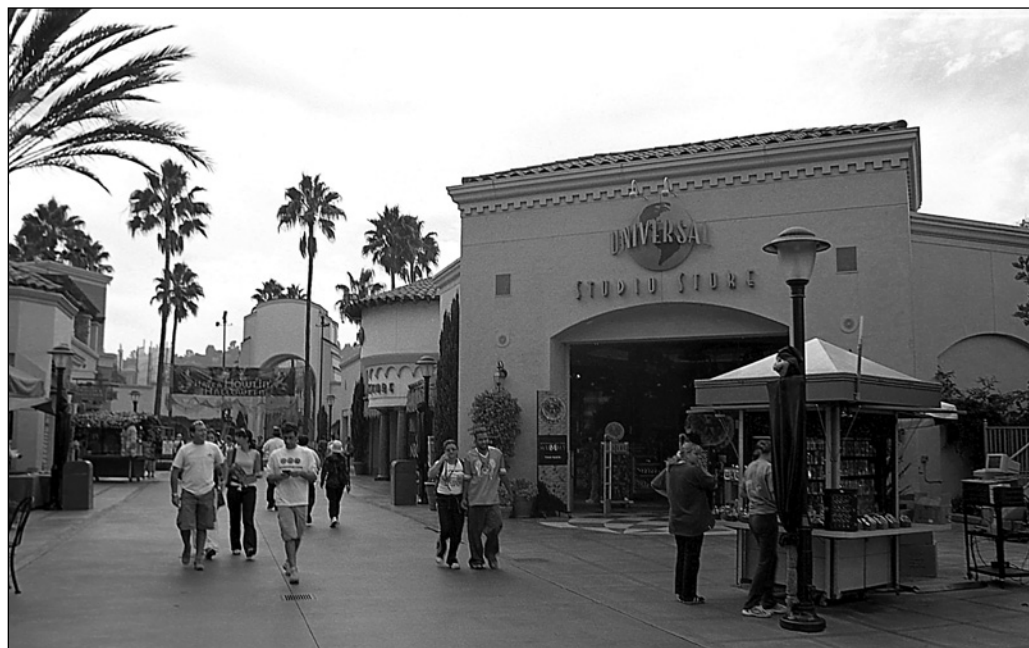
ILLUSTRATION 1 : Les touristes, attirés par les activités cinématographiques, visitent notamment des studios de cinéma.

cinéma du monde entier (producteurs, réalisateurs, scénaristes, etc.) et aux responsables des villes et des régions intéressées à accueillir des équipes de tournage, confirme aussi l'intérêt des destinations à convaincre les producteurs de cinéma de tourner et filmer dans certains lieux (Désiront, 2009). Les voyagistes et les agents de voyages sont aussi invités puisque le ciné-tourisme constitue pour eux un filon à exploiter, avec les circuits qui emmènent les voyageurs sur les lieux qui ont servi de décor à des films populaires (Désiront, 2009) (voir illustration 2).