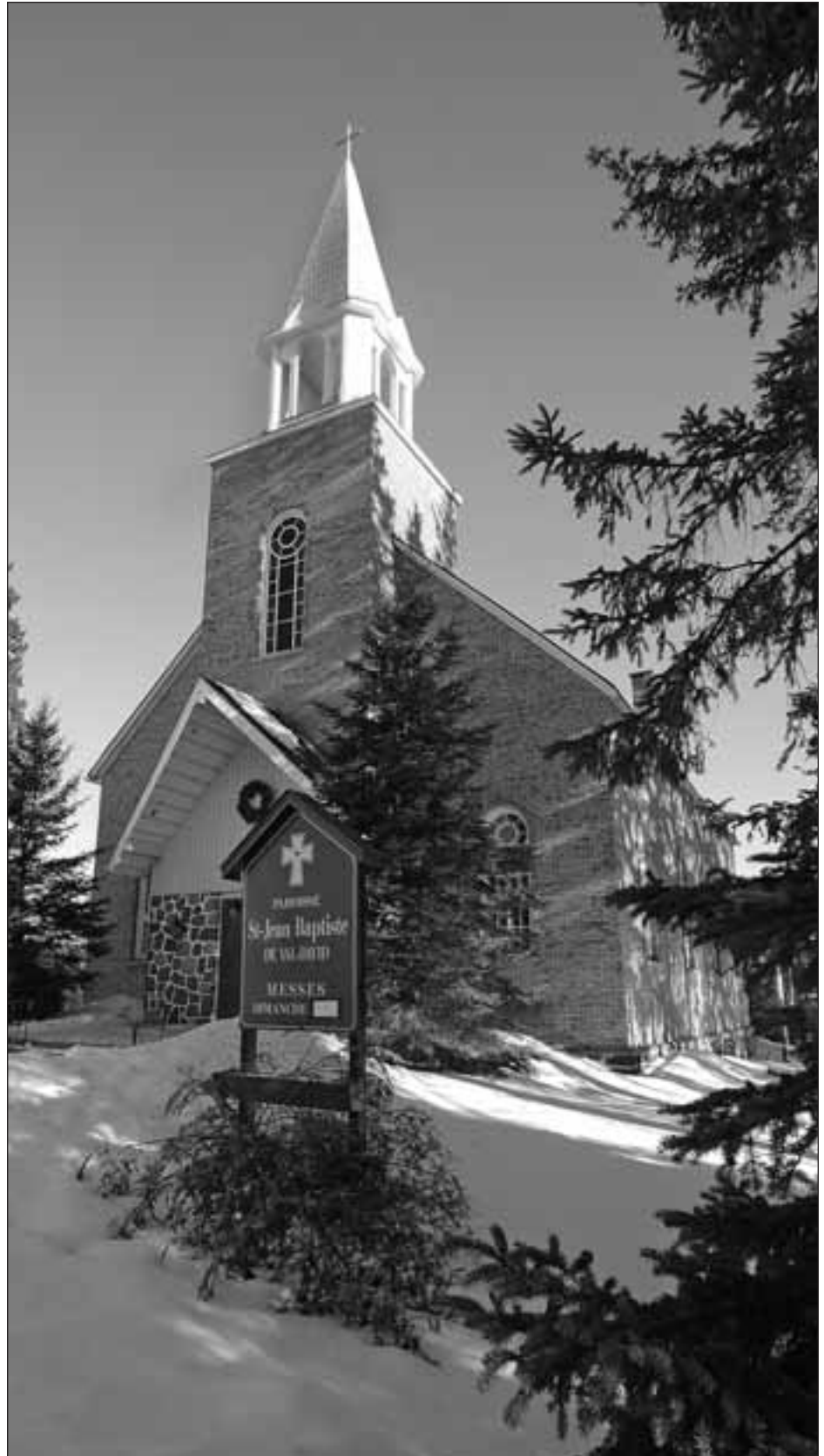
Église de Val-David, Laurentides 10.