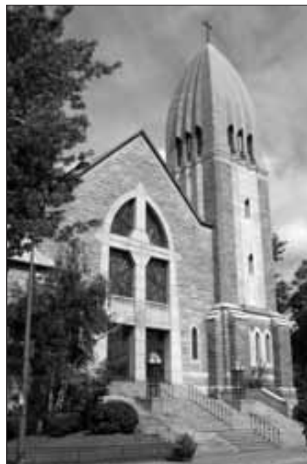
« La Porte vers le ciel ». Vue extérieure de l'église Saint-Arsène, Montréal 22 .