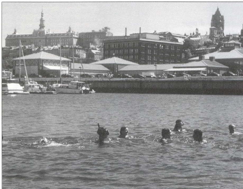
À Québec, la reconquête citoyenne d'un plan d'eau urbain : le bassin Louise.