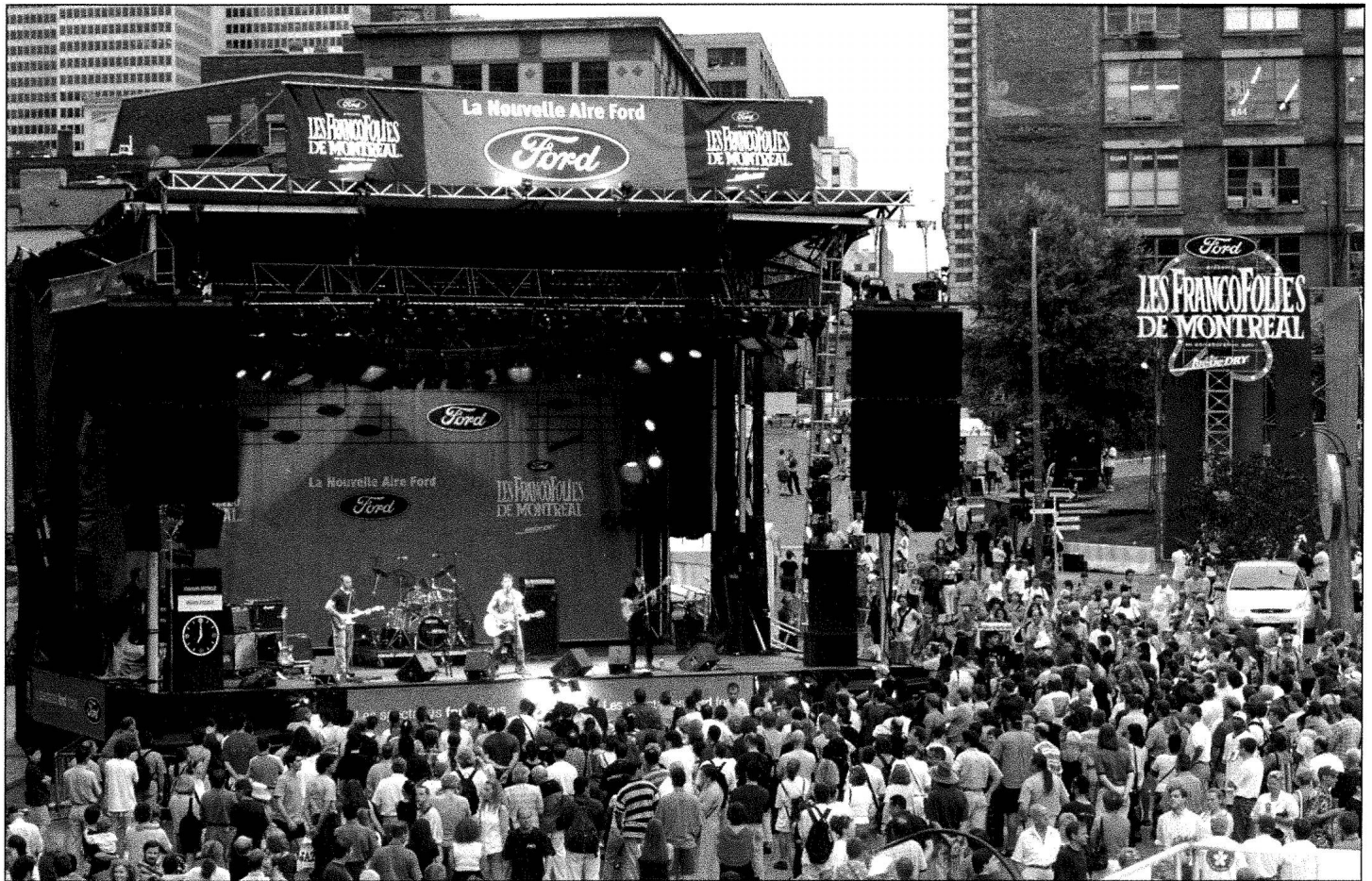
Francopholies de Montréal

Aujourd'hui, l'« art-de-recevoir-des-touristes » se limite souvent encore à une tâche minimale de communication. Parler d'art à ce propos est peut-être un abus de langage ! Actuellement au Québec, par exemple, on peaufine un projet de politique d'accueil touristique. Voici un extrait significatif d'un document de consultation qui circule : « Ce projet s'inscrit principalement dans le suivi de la politique de développement touristique où l'accueil et l'information demeurent des facettes stratégiques dans la poursuite du virage client préconisé comme orientation au sein de l'industrie touristique » (Groupe DBSF, 1999 : 2).