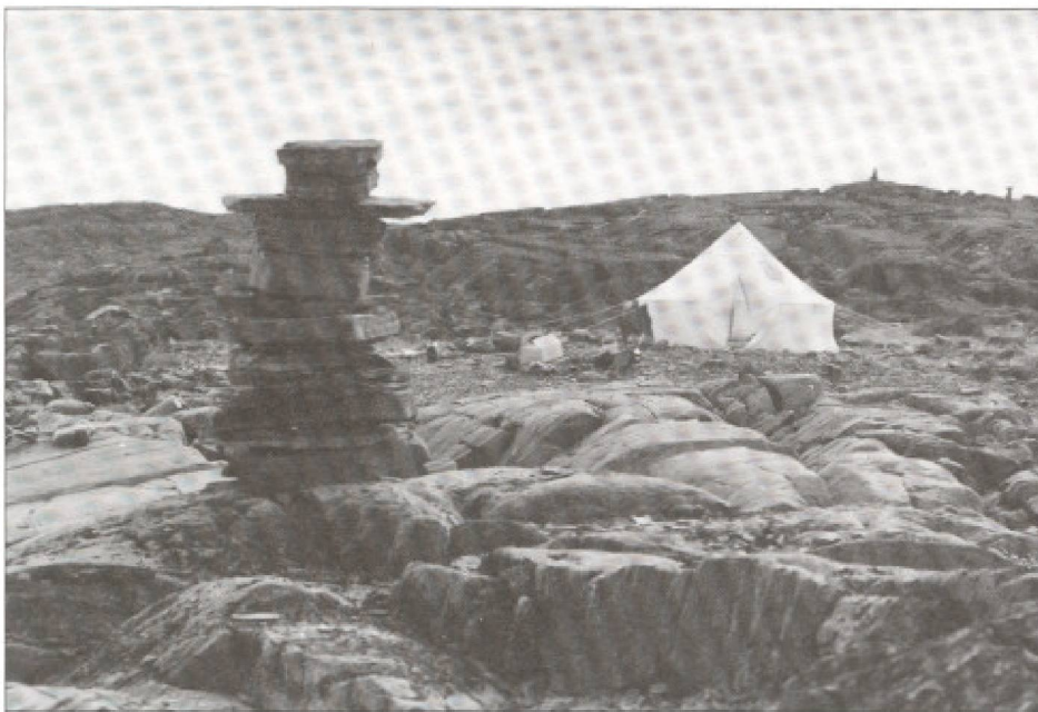
Les statues. Les Inukshuit, sorte de sculptures inuit ayant une utilité directionnelle, symbolique et magique, sont les seuls monuments nordiques. Dans un contexte futurogène, ils devraient être intégrés au redéveloppement du tourisme d'aventure de cette région, créer des emplois de «construction» et redevenir des attraits centraux dans le grand-espace de la toundra.

L'Aventure avec un seul A, est un acte de vie principalement culturel et temporairement vécu au sein des grands espaces naturels et évocateurs que la terre a su conserver au regard de l'homme des années 2000. Pour s'y plonger, le touriste aventurier n'a plus besoin de sacrifier son confort, sa sécurité, ni de négliger son alimentation. Bien au contraire, les progrès techniques et scientifiques lui permettent déjà - à l'aube du troisième millénaire - d'expérimenter à un âge avancé - des moments intenses, dans des milieux isolés, là où jusqu'à présent, seuls des jeunes gens se risquaient à l'aventure.