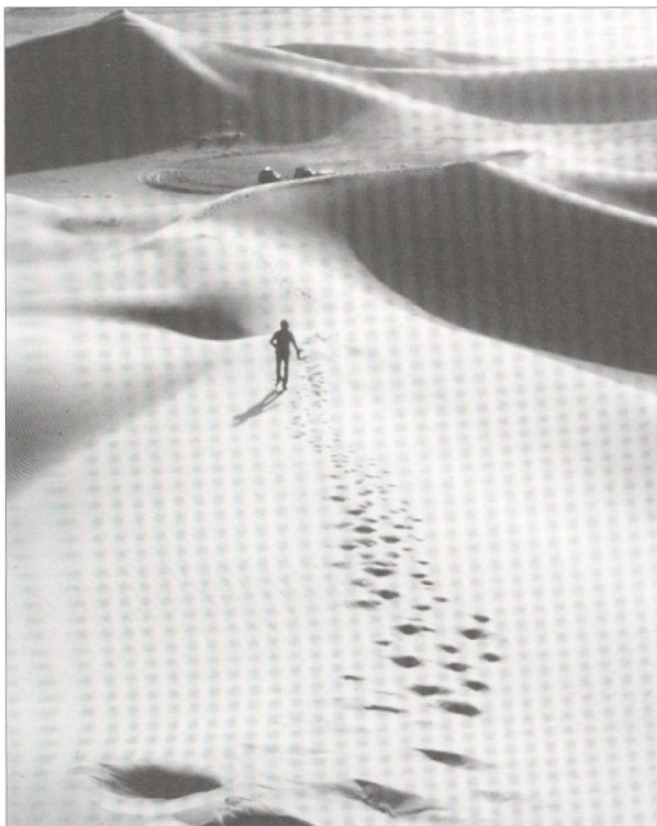
Sahara, Club Aventure.