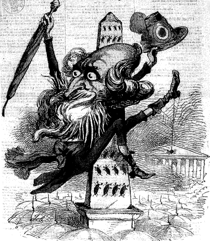
Le grand Général sur l'offensive. *Note: — Grouper, de lui de la mort, quatre vingt mille... (P) Plaque au restaurant.