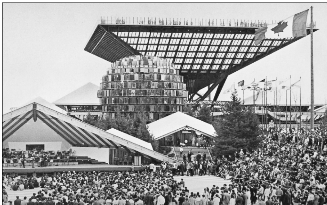
Figure 1. Pavillon du Canada