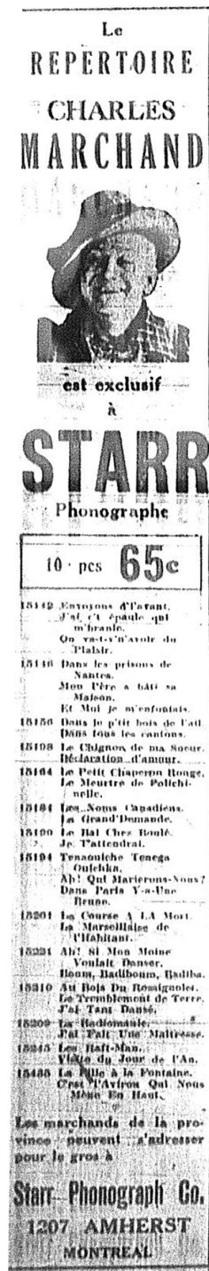
Figure 3 : Publicité des disques Starr parue suite au décès de Marchand ( La Presse , 17 mai 1930, 48).