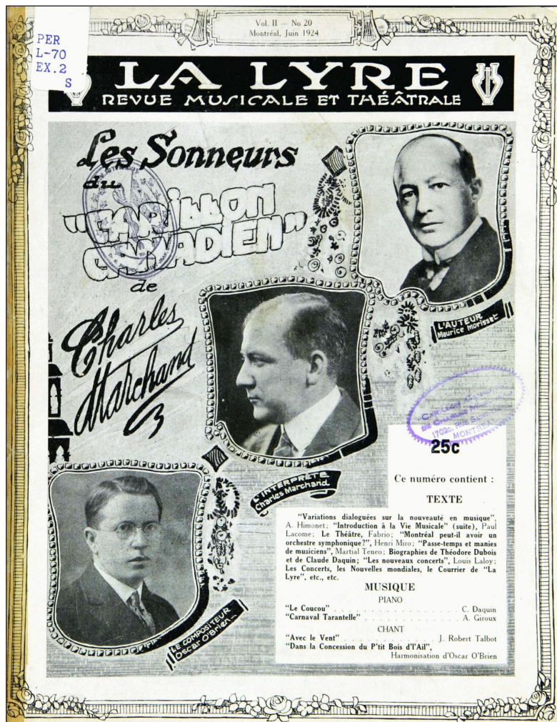
Figure 1 : Le Carillon canadien en page titre de La Lyre , juin 1924 (n° 20).

Allard se démarquent parmi les concurrents. La presse indique que le jury est composé de Charles Marchand, Albéric Bourgeois et Eugène Belley 17 .