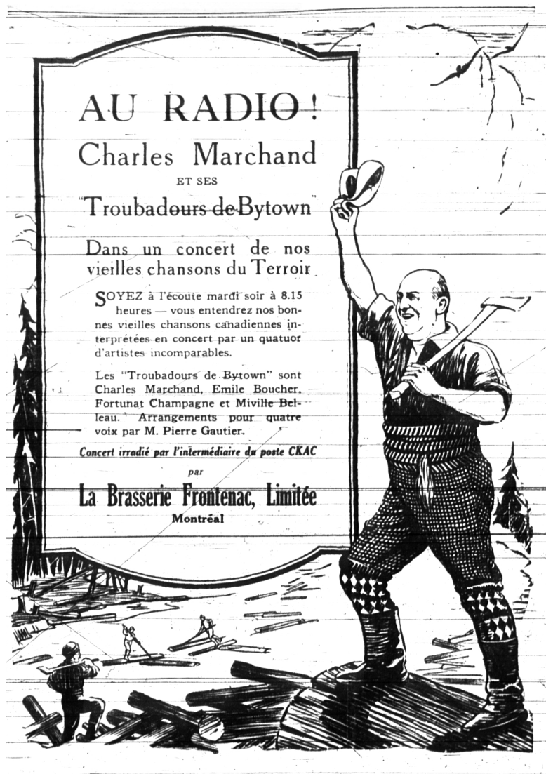
Figure 4 : Charles Marchand costumé en draveur à ceinture fléchée pour une émission spéciale de la Brasserie Frontenac à CKAC ( La Presse , 28 novembre 1927, 10).

Au matou botté, fondée à Montréal en novembre 1929 31 . Moins d'un mois après l'ouverture de l'établissement, le 16 décembre 1929, le journal La Patrie nous informe que Marchand a chanté une fois dans cette boîte, à l'occasion d'un «thé-dansant» [sic] du samedi soir («Le chant, la danse et l'humour, "Au Matou botté"» 1929, 8). Quant à Dupuis-Maillet, une mécène et dilettante des arts, elle s'intéresse tout autant à la littérature qu'à la musique et à la peinture. Elle sera en 1947 la directrice de la revue littéraire Amérique française , dans laquelle publient Jacques Ferron et le jeune Gaston Miron.