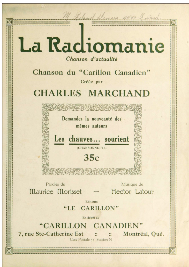
Figure 2 : Page titre de la partition en feuille de «La radiomanie», une chanson du Carillon canadien de Marchand (Éditions La Lyre, 1925 ; réimpression Le Carillon, 1926).

sympathique réservé à notre chanteur, il nous semble que Le Carillon est né viable (Morisset 1926, 3).