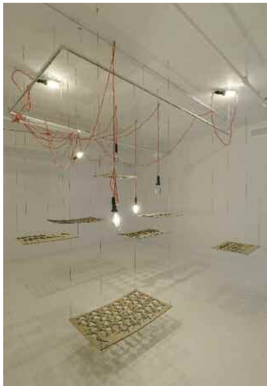
Soulèvement social , 2014 vue d'exposition (Circa, Montréal)

PHOTO DE LA PAGE 19 / Sans titre , 2012 crayon couleur sur papier, 42 x 29,7 cm