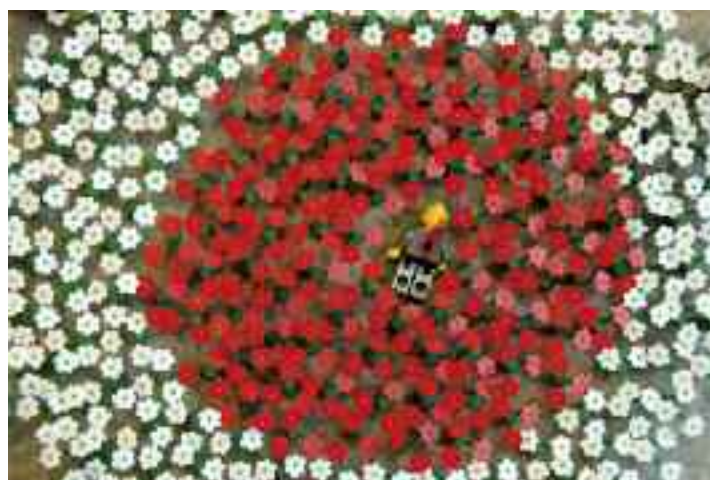
Fox & Friends (détail), 2013 (Vaste et Vague, Carleton-sur-Mer)