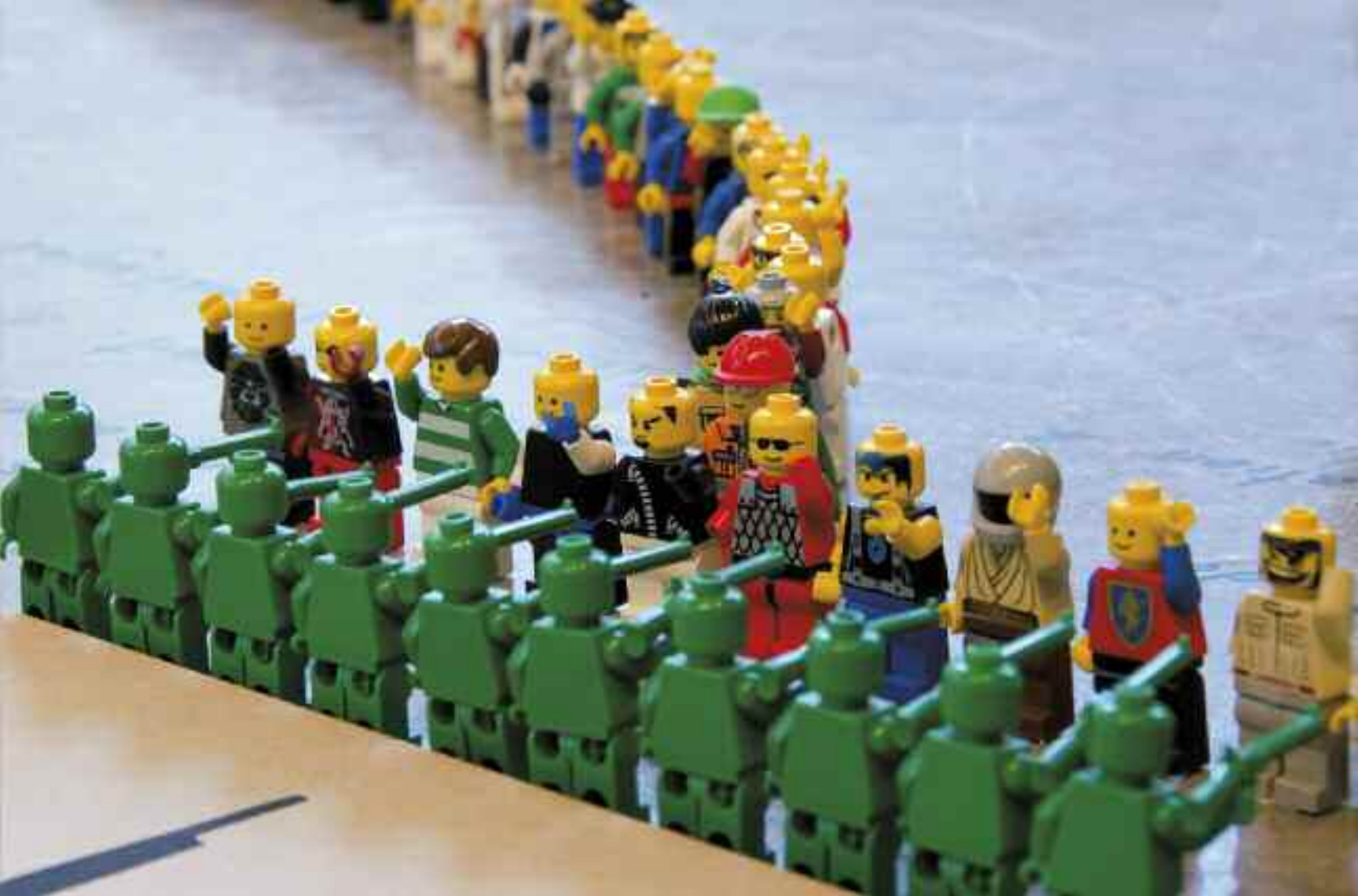
Fox & Friends (détail), 2013 (Vaste et Vague, Carleton-sur-Mer)

familière s'éclipse pour laisser place à des personnages intrigants. L'enfance, si elle n'est jamais loin, a désormais perdu son innocence.