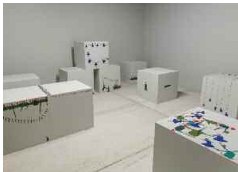
Micropolitiques (détail) , 2014

Jusqu'en 2012, Sayeh Sarfaraz associe aux jouets des tracés et des organigrammes mettant en scène des personnages-clés de la mappemonde géopolitique. La cartographie mobilise dans ses