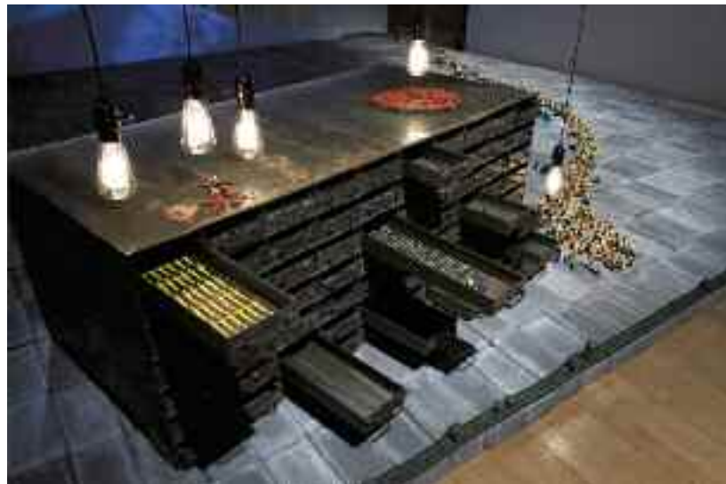
Étrange dictature (détail), 2013 photo : Alexandru Argh

premières installations des noms de dirigeants, des mots-clés et des définitions neutres issues de Wikipédia, visant les arcanes du pouvoir au Moyen-Orient et de plusieurs puissances occidentales. L'artiste enchevêtre cette cartographie avec des scènes en élévation pour composer de vastes dioramas qui désamorcent l'abstraction première de la cartographie, afin de revenir à des éléments concrets. Elle place les jouets manufacturés et les dessins comme autant de points de bascule d'une carte dressée fragilement à même la structure du lieu qu'elle investit dans ses moindres recoins. Les installations de Magic Never Ends , THE TYPHOON CONTINUES AND SO DO YOU , Mapping the World USA , Dictator is in town déploient ainsi le schéma de la puissance militaire au cœur du dispositif d'exposition, sur son sol ou ses murs. Cette stratégie de la cartographie s'associe à celles des « récits et histoires », du « carnavalesque », de « la reconstitution et de la fiction », citées à titre de principales méthodes employées en art politique contemporain par Zanny Begg et Dmitry Vilensky. Elle permet à Sayeh Sarfaraz de creuser la