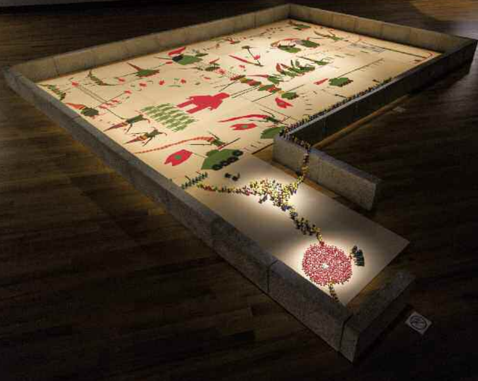
Fox & Friends , 2013 vue d'exposition (Maison de la culture Frontenac, Montréal)

à d'autres contextes, où l'agitation politique et les mouvements populaires secouent aujourd'hui les communautés : élection contestant le processus démocratique, censure et emprisonnement de journalistes, exécutions publiques, tortures, manifestations publiques... Il faut considérer cette accumulation de référents et d'enjeux politiques dans ses œuvres non pas comme un effort de catalogage à visée exhaustive, mais davantage comme la fabrication d'une boîte de Pandore mouvante. Les maux actuels qui s'en échappent se combinent alors en un inventaire