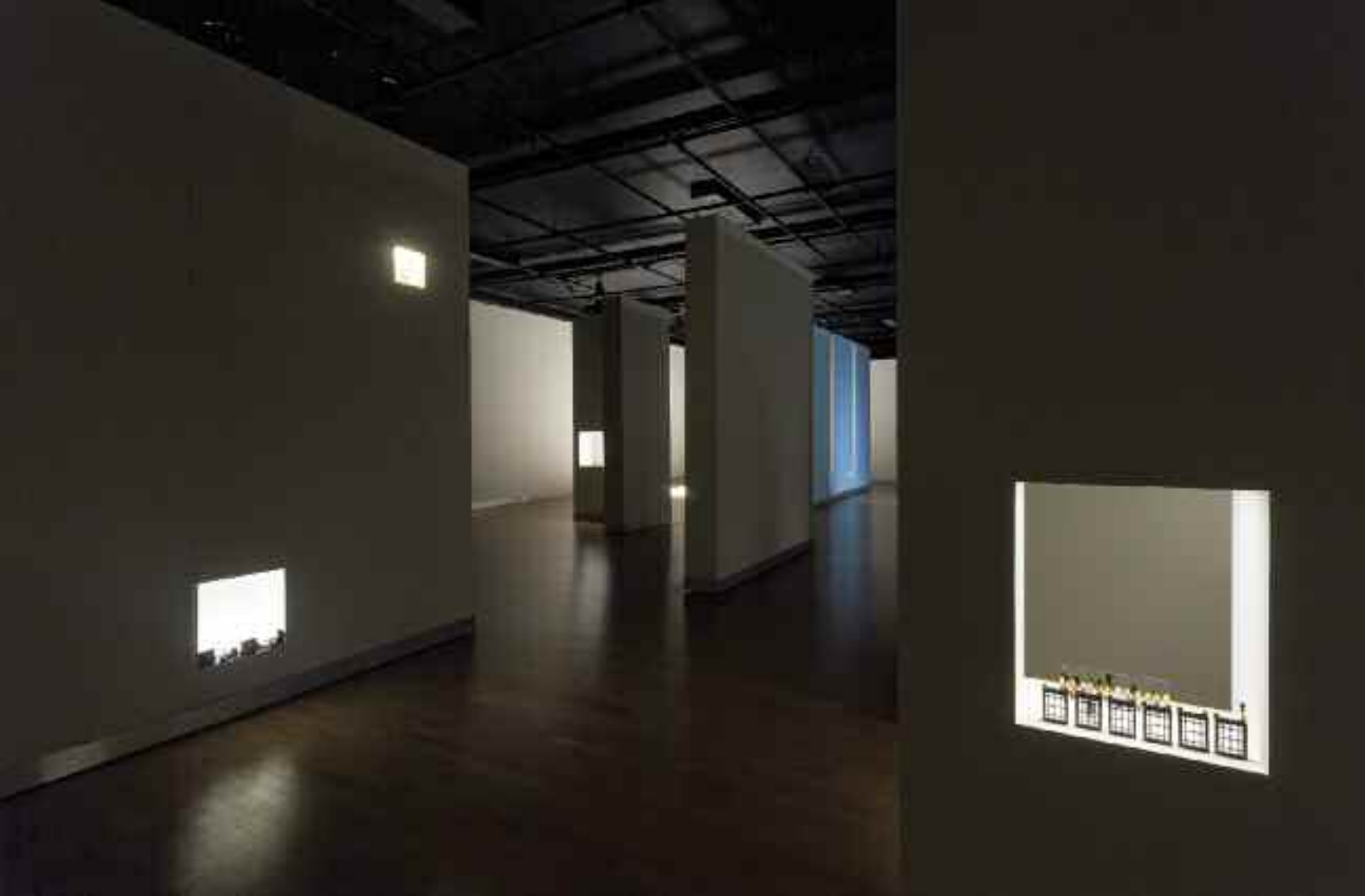
Micropolitiques , 2014 vue d'exposition (Salle Alfred-Pellan, Maison des arts de Laval)