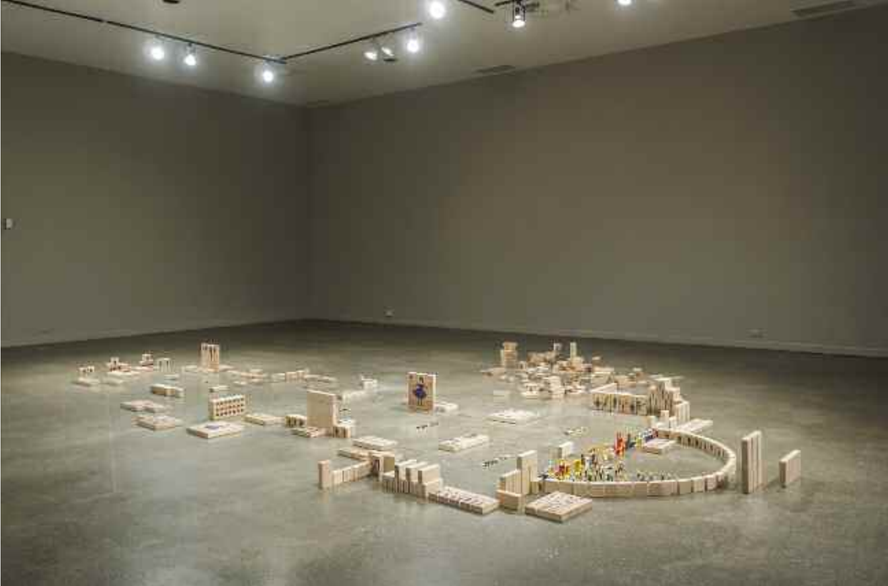
Let's Play Again? = On rejoue? , 2014 vue d'exposition (Galerie d'art Foreman de l'Université Bishop, Sherbrooke)