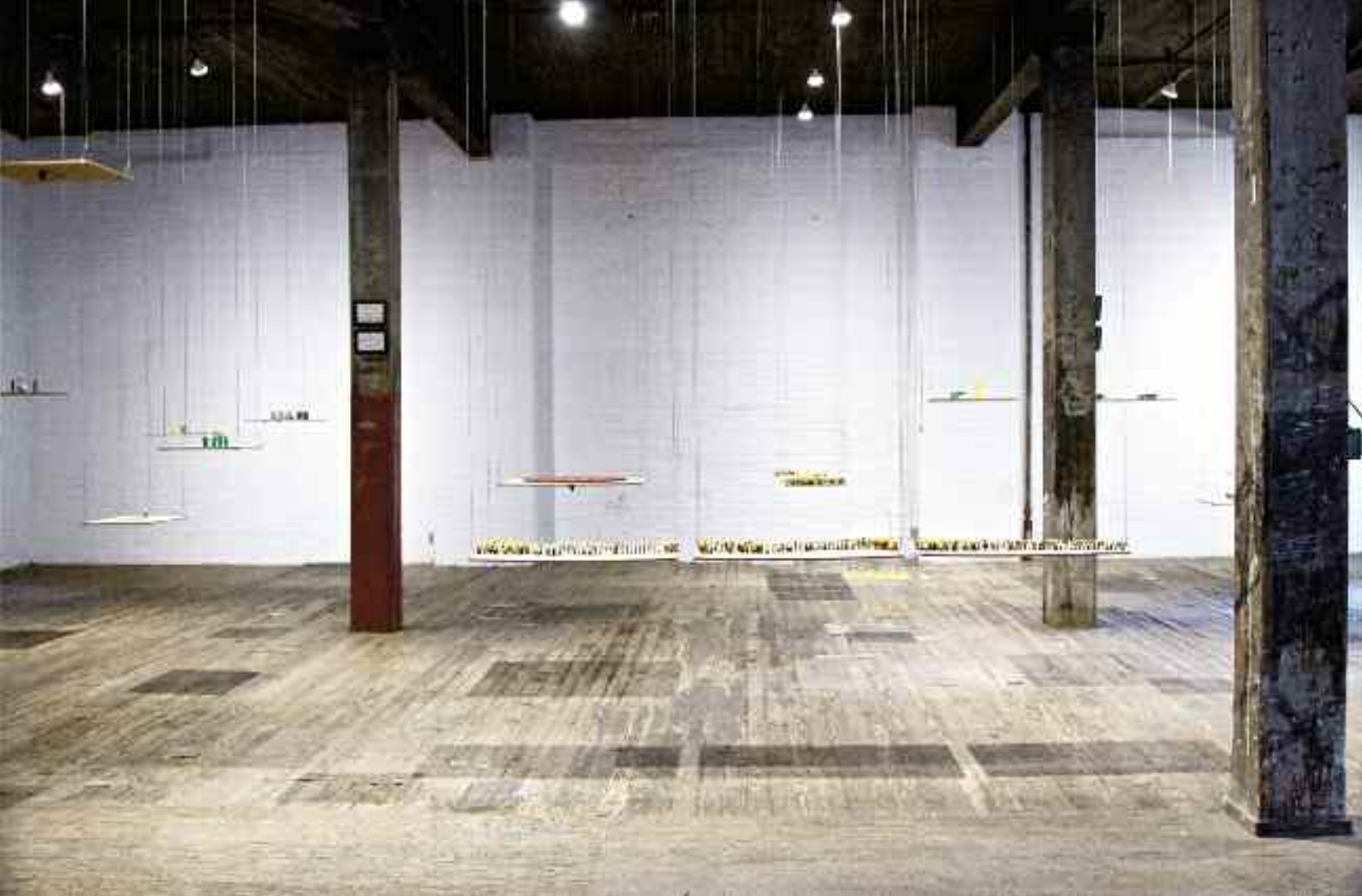
Wolves in the Wall , 2014 vue d'exposition (The Invisible Dog Art Center, Brooklyn)