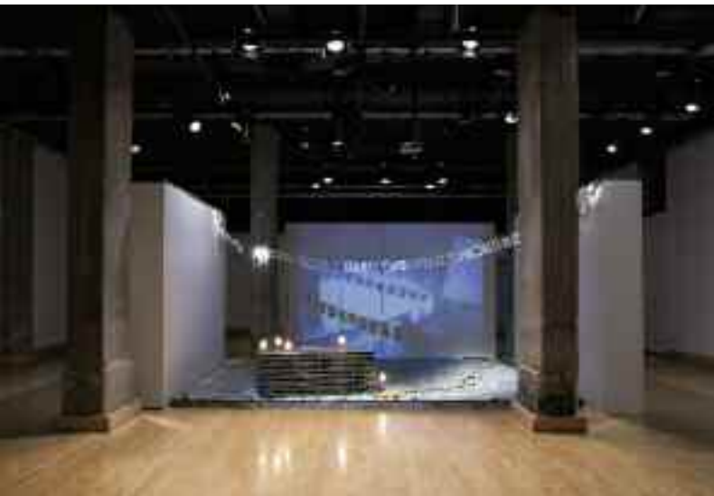
Étrange dictature , 2013 vue d'exposition (Montréal, arts interculturels)