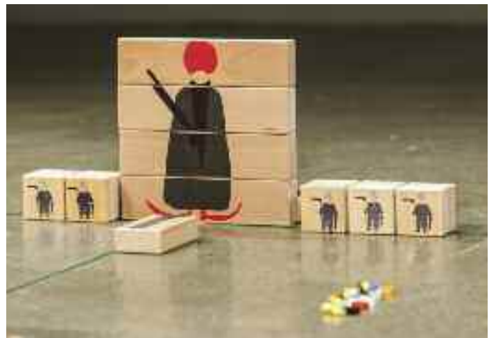
Let's Play Again? = On rejoue? (détail), 2014