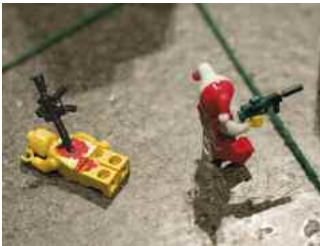
Let's Play Again? = On rejoue? (détail), 2014