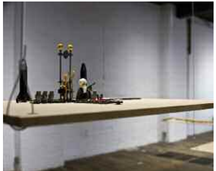
Wolves in the Wall (détail), 2014