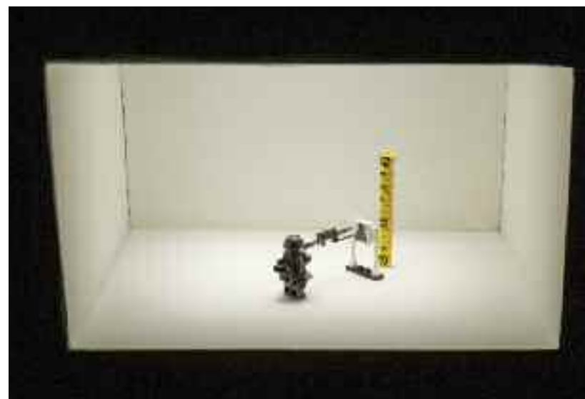
Micropolitiques (détail), 2014