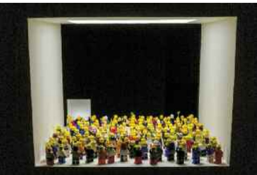
Micropolitiques (détail), 2014