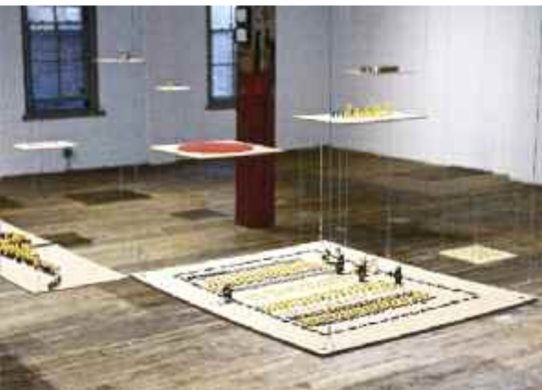
Wolves in the Wall (détail), 2014