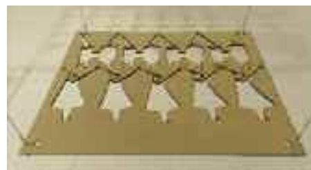
Soulèvement social (détail) , 2014