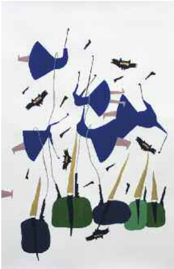
Au pays des Mollahs , 2015 gouache sur papier, 30 x 20 cm

Elle forme des dioramas denses où prédominent des figurines colorées, érigées en reliques du pouvoir politique et de ses dissidents. Le chaos et le multiple sont orchestrés par des formes récurrentes tels que le cercle fait de centaines de fleurs, la colonne de manifestants ou la rangée de chars et Bassidjis (milice paramilitaire placée sous les ordres de la Garde révolutionnaire iranienne qui a violemment réprimé les manifestations en 2009) dressée devant eux. Ces scènes de foule miniature sont par ailleurs intercalées de scènes davantage minimales, où chaque élément vient