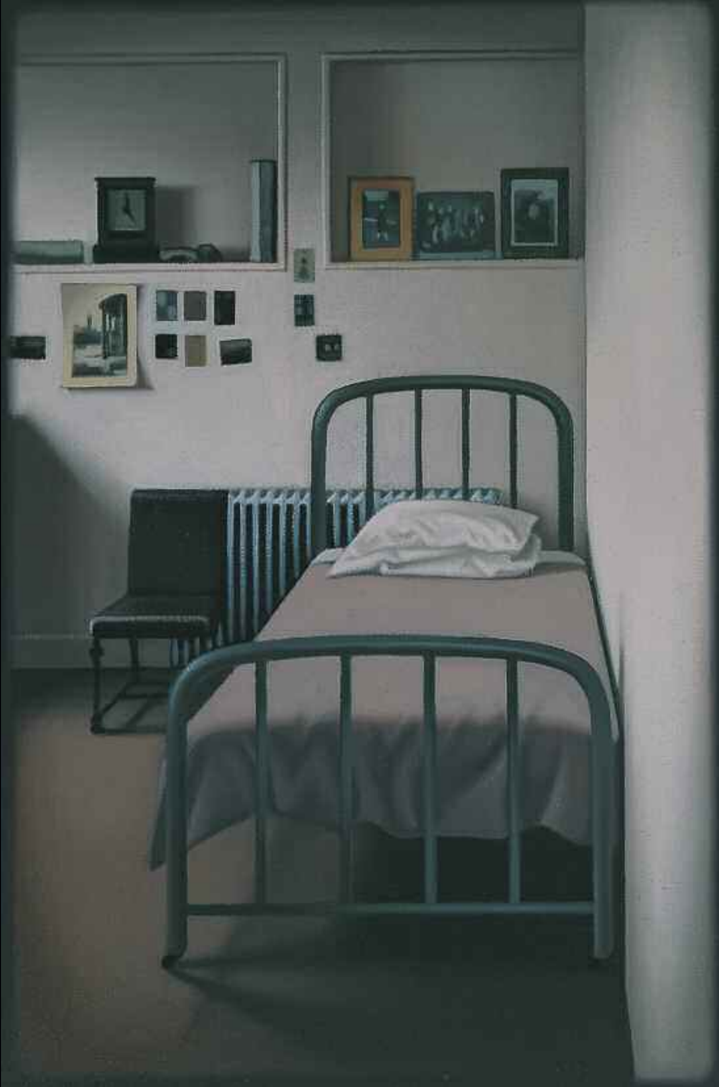
La Chambre à l'atelier, 1996. Huile sur toile de lin, 61 x 40,6 cm. Collection particulière.