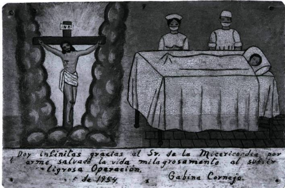
Anonyme, El señor de la Misericordia , 1954, huile sur métal, 15 × 23 cm.

marque de ce à quoi je suis habitué. La décision de me rendre disponible découle d'un jugement, ou d'une partie d'un jugement (si l'on peut décomposer le jugement en parties) situé à mi-chemin entre une prédisposition et un engagement réel avec l'œuvre. Ce jugement ne pose pas seulement la question est-ce de l'art? ou est-ce du bon art? La question ne se pose d'ailleurs pas en ces termes pour un objet comme l' ex-voto qui s'inscrit dans une tradition qui ne reconnaît aucune séparation entre ses dimensions esthétique et religieuse. Mais peu importe le régime esthétique dans lequel on se situe, le jugement auquel je fais référence répond à une présentation