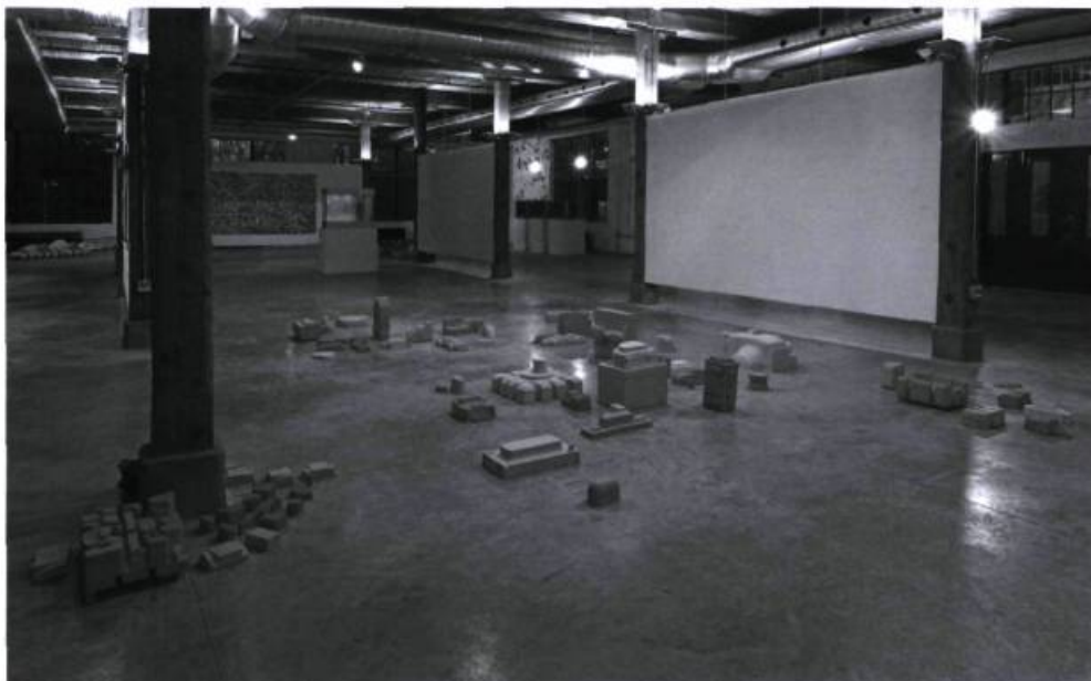
Laura St-Pierre, Superstructure , 2005, Acrylique sur polystyrène expansé, craie. Dimensions variables.

Cette tendance à représenter des signes de notre milieu de vie fut reprise par plusieurs artistes de l'exposition. Parmi ceux-ci, Clint Neufeld offrait au spectateur toutes les pièces nécessaires, une vidéo explicative ainsi qu'un plan pour que l'on puisse assembler, à la manière