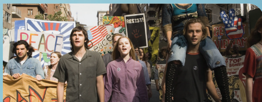
ACROSS THE UNIVERSE [2007] JULIE TAYMOR

Réalisé à l'aube des années 2000, Chicago , film de Rob Marshall, présente le classique de Broadway Chicago , écrit en 1926 par la journaliste Maurine Dallas Watkins, et fut adapté de la comédie musicale éponyme présentée sur Broadway en 1975 – mise en scène par Bob Fosse, écrite par Johan Kander et Fred Ebb, soit ceux derrière le film Cabaret . Le film remet au goût du jour le classique de Broadway avec le grand talent des actrices Renée Zellweger et Catherine Zeta-Jones, sans oublier les chansons jadis popularisées sur scène, dont «All That Jazz». Nommé dans 13 catégories à la 75 e cérémonie des Oscars, le film remporte six statuettes, dont celle du meilleur film.