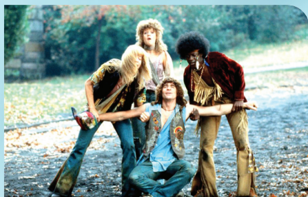
HAIR [1979] MILOS FORMAN

Si les premières comédies musicales ressemblent davantage à des pièces de théâtre filmées, l'évolution technologique et la Grande Dépression plongent rapidement le genre dans son âge d'or, des années 1930 à 1960. La comédie musicale facilite le respect du code Hays, elle attire également les spectateurs au cinéma, en cette période sombre caractérisée par la crise économique, du Krach de 1929 à la Deuxième Guerre mondiale. En Technicolor, la comédie musicale a tout pour divertir, avec ses univers colorés et ses chorégraphies dansées et chantées. Or, si sa musique, comme sa mise en scène, joue un rôle majeur dans l'expression des personnages et l'évolution de l'histoire, nous aurions tort de cantonner le genre à la comédie, d'où le terme anglophone musical , qui fait honneur à la diversité du genre.