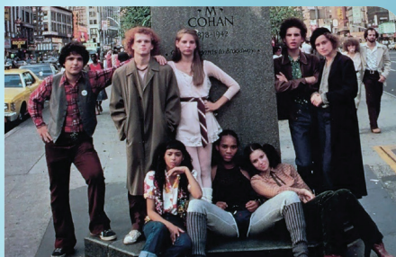
FAME [1980] ALAN PARKER

À la manière de Meet Me in St. Louis (1944) de Vincente Minnelli, Hair se situe dans la veine des folk musicals , où les personnages chantent et dansent au sein d'un récit qui tend davantage vers le drame, avec un propos social. Adaptation cinématographique du succès de Broadway, Hair met en scène un jeune homme de l'Oklahoma, venu à New York pour s'enrôler dans l'armée, qui se fait rapidement séduire par la contre-culture hippie. C'est le film culte d'une génération, celle des peace and love qui s'opposent à la guerre du Vietnam par le biais du pouvoir de la musique en chantant les pièces cultes «Aquarius/Let the Sunshine In».