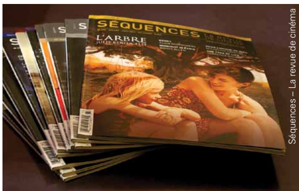
Séquences — La revue de cinéma

Mais ne vous fiez pas à elle. Voyez plutôt ce que son portfolio inspire.