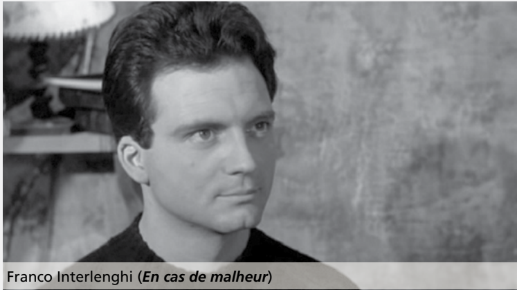
Franco Interlenghi ( En cas de malheur )