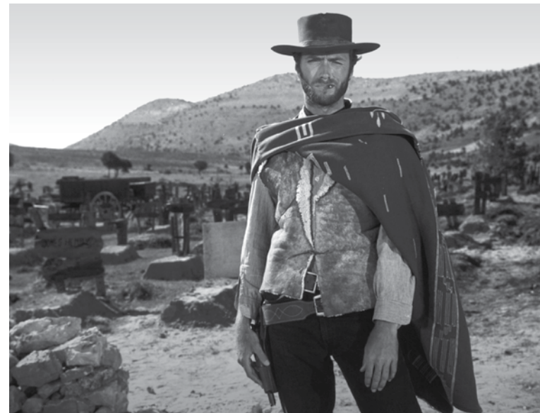
Clint Eastwood dans Le Bon, la Brute et le Truand