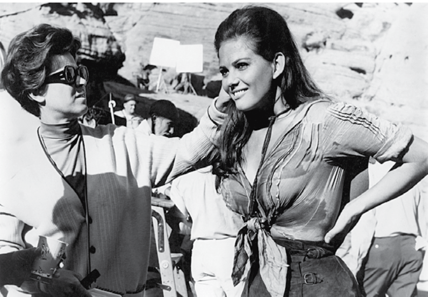
Claudia Cardinale sur le tournage de Il était une fois dans l'Ouest