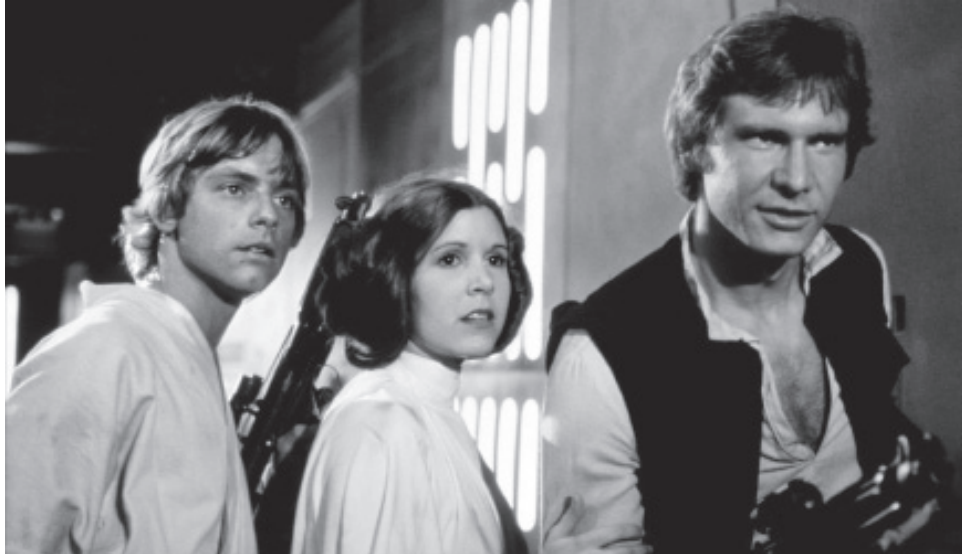
Star Wars: Episode IV - A New Hope