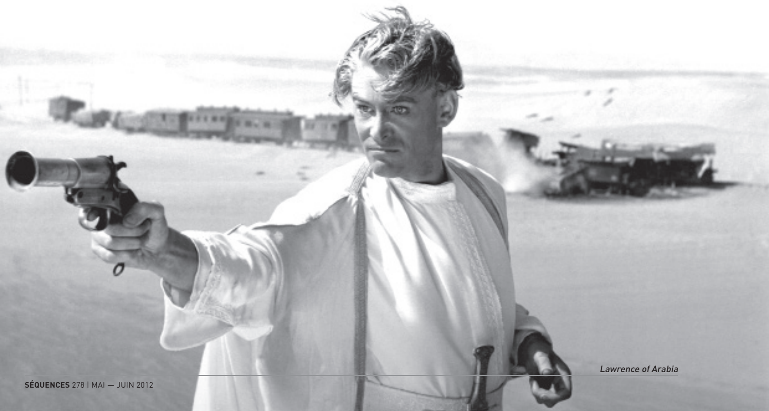
Lawrence of Arabia

Les tournages et montages télévisuels en format numérique ont à peu près signé l'arrêt de mort de la télévision axée sur le contenu. Les journalistes sont aujourd'hui condamnés à tenter de rattraper la technologie alors que c'est cela même qui les freinait il y a vingt ans, leur donnant alors la possibilité d'absorber l'information et d'y réfléchir. Plus puissante ressource d'information cinématographique au monde, Internet réunit en un même tas les critiques vétérans et les nouveaux venus, lesquels (dont nous sommes)