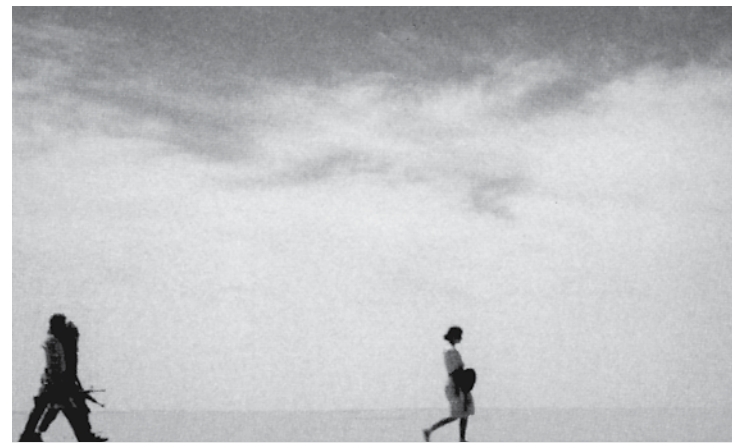
La Captive du désert

cette chance. Un début dans une œuvre documentaire peut se faire, se construire, en plein milieu de tournage, à n'importe quel moment, comme ça ! C'est extrêmement riche.