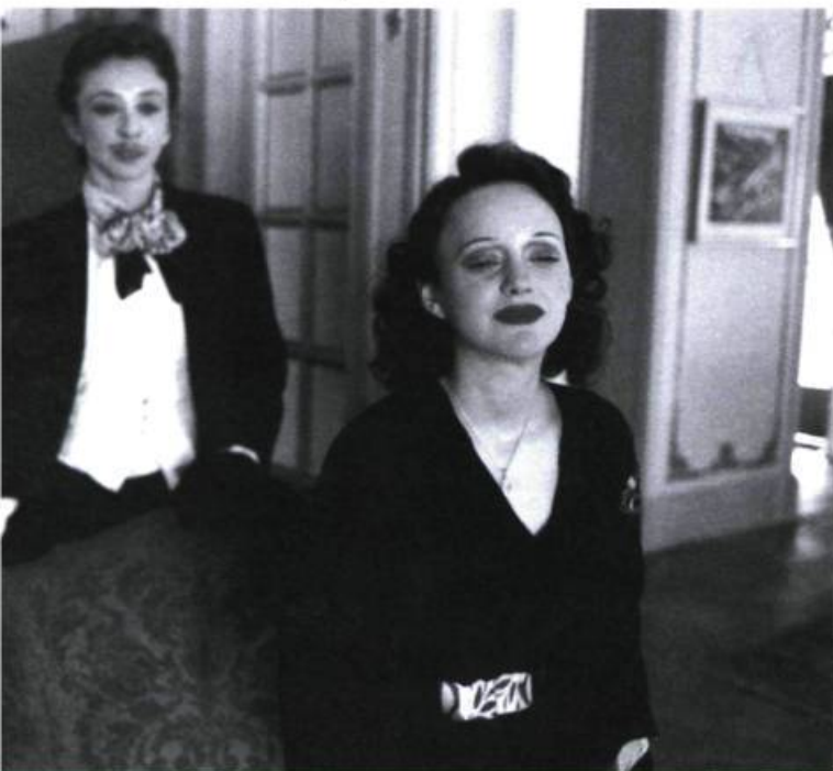
La Vie en rose