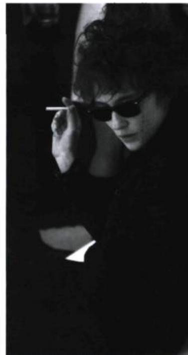
Une aisance époustouflante