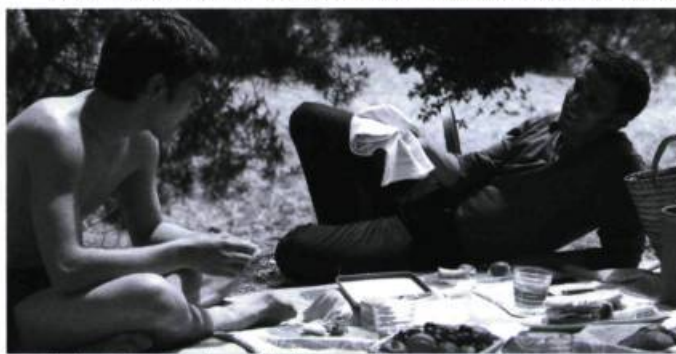
Le temps des amours libres et interdites

Mais pour les personnages de Téchiné ce n'est que lorsque l'un d'eux est atteint que tout change. Pour chacun, c'est la fin d'une époque et le début d'une autre qui, elle, sera marquée par un ajustement quant à la vie et à l'amour. Téchiné montre bien que tout ne sera plus pareil, que le virus dont il est question va changer les mœurs, les mentalités et la sexualité.