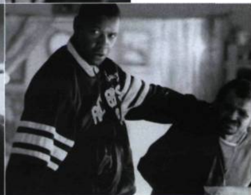
Man on Fire