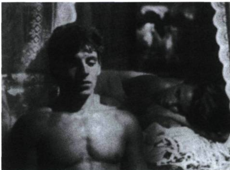
L'Homme de cendre

Le cinéma du Burkina Faso est à l'honneur cette année. Nous allons présenter un panorama de cette cinématographie nationale. Le Burkina Faso est un pays africain très spécial dans la