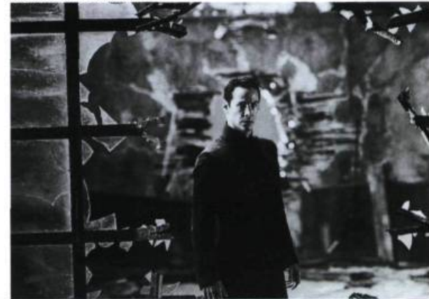
The Matrix Revolutions

C'est sans doute la raison pour laquelle Ann, qui s'adresse en voix-off à elle-même à la deuxième personne et que la caméra traque en de multiples gros plans, choisit de ne pas informer ses proches de la situation et entreprend de savourer ses derniers moments en établissant une liste de prior-