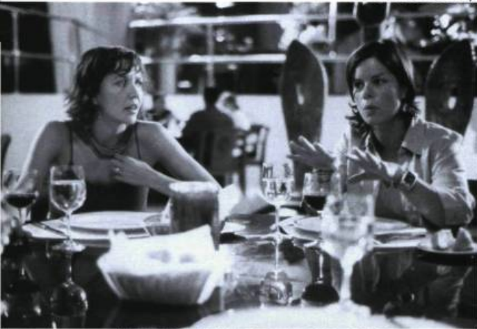
Casa de Los Babys