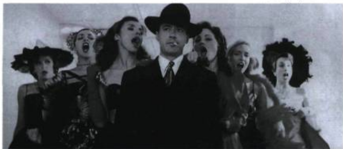
The Singing Detective

dans un enchevêtrement de scènes musicales imaginées, de flash-backs et de rêves de fièvre. Même s'il semble un peu jeune pour le rôle et si la subtilité des dialogues de Potter se perdent parfois dans ses marmonnements, Robert Downey Jr. se glisse avec style, sensibilité et justesse dans la peau de Dan Dark, offrant une interprétation des plus personnelles sans tenter d'imiter l'extraordinaire Michael Gambon qui avait créé le rôle. Bien qu'une comparaison avec la série originale soit inévitable, de trop s'y attarder ne rendrait justice ni au jeu nuancé des excellents comédiens — dont un Mel Gibson tout en finesse dans un contre-emploi surprenant —, ni au travail toujours étonnant de Keith Gordon, l'un des plus singuliers cinéastes indépendants américains actuels. Mother Night et Waking the Dead , adaptés de romans réputés inattaquables de Kurt Vonnegut et Scott Spencer, plongeaient