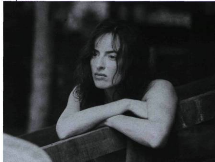
Le Papillon bleu

Canada [Québec] 2003, 85 minutes — Réal. : Micheline Lanctôt — Scén. : Micheline Lanctôt — Int. : Sylvie Drapeau, Frédéric de Grandpré, Shanie Beauchamps, Pierre-Luc Lafontaine, Ghislain Tremblay, Onil Mélançon, Micheline Poitras, Francis Rose — Dist. : Alliance.