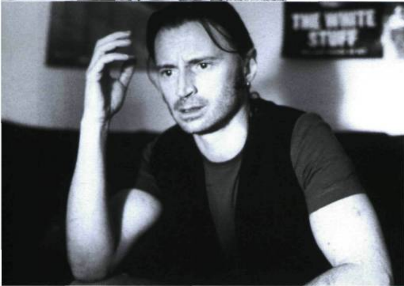
Once Upon a time in the Midlands