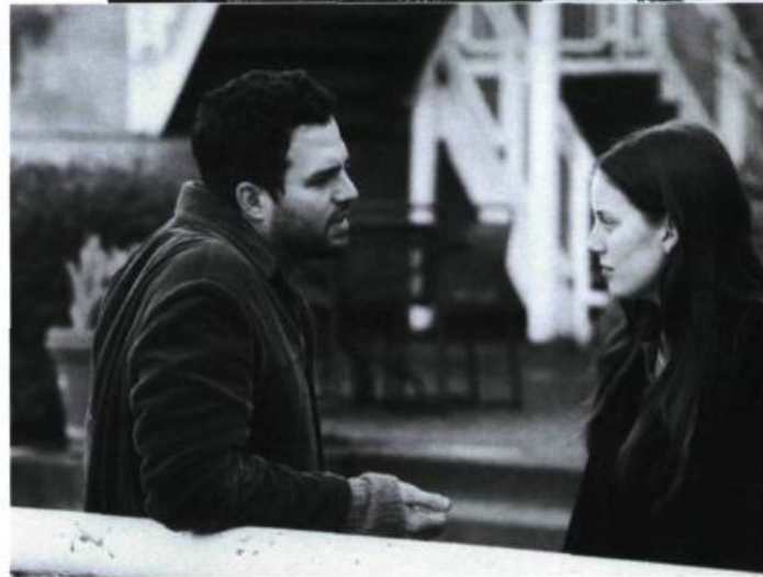
My Life Without Me

ités (dire à ses filles qu'elle les aime à tous les jours, trouver une femme à son mari, etc.).