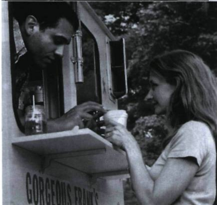
The Station Agent