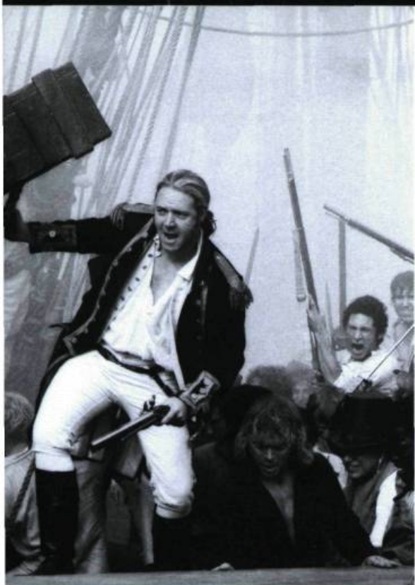
Master and Commander : The Far Side of the World