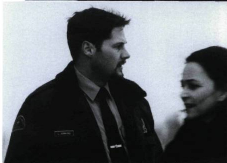
Le Piège d'Issoudun