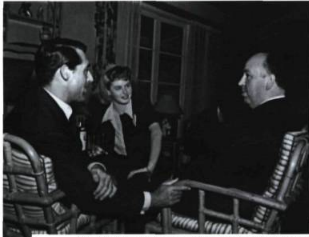
Cary Grant, Ingrid Bergman et Alfred Hitchcock | Notorious

télévisée, de même que la collection de nouvelles littéraires de suspense portant son nom. L'internaute pourra continuer sa lecture de dossiers et d'articles des plus divers sur le site The MacGuffin Web Page . Rédigés par différents érudits de l'œuvre du maître, les articles que l'on y retrouve sont plus pointus tout en demeurant accessibles. Retenons « Introduction to Hitchcock », un essai constituant un excellent point de départ pour aborder l'homme et son œuvre ainsi que « The Original Previewed Ending for Suspicion », article fascinant sur les démêlés entourant les différentes fins possibles du film Suspicion .