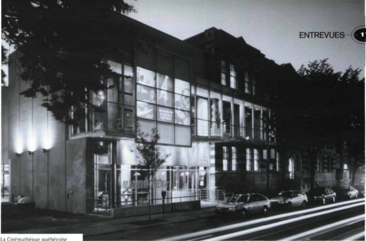
La Cinémathèque québécoise