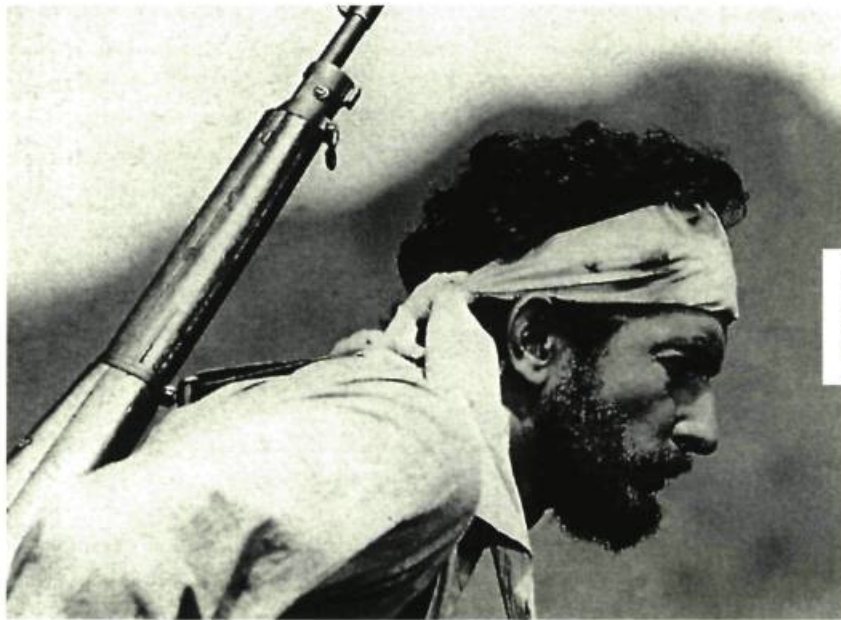
Las Aventuras de Juan Quinquín

Nous avons beaucoup discuté quant aux avantages et aux inconvénients d'un cinéma privé par rapport à un cinéma d'État, et si le cinéma d'État était, forcément, un cinéma de propagande. Ce problème s'est posé dès le commencement. Au début, on vivait, en