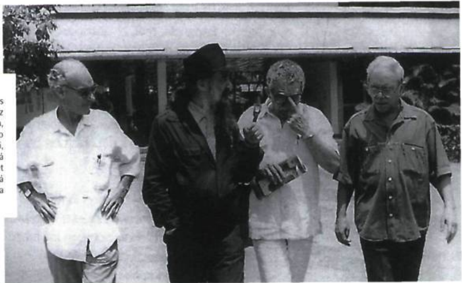
Tomás Gutiérrez Alea, Fernando Birri, Gabriel García Márquez et Julio García Espinosa

plus arriéré de tous parce qu'il confond le développement technique et le développement du langage cinématographique; parce qu'on applaudit la technologie en pensant applaudir l'art. Dans les années 60, j'ai écrit dans La búsqueda del cine perdido : « Le devoir d'un cinéaste révolutionnaire est de faire la révolution dans le cinéma ». Aujourd'hui, faire la révolution dans le cinéma veut dire garantir le droit de voir des films du monde entier. ❧