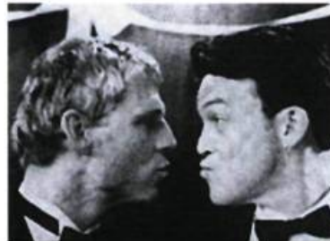
Swallows, de Harvey Marks

Image et Nation | Festival international de cinéma gai et lesbien de Montréal