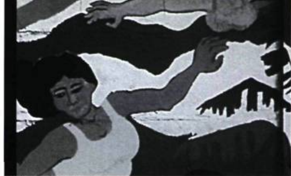
L'introspection d'un pays