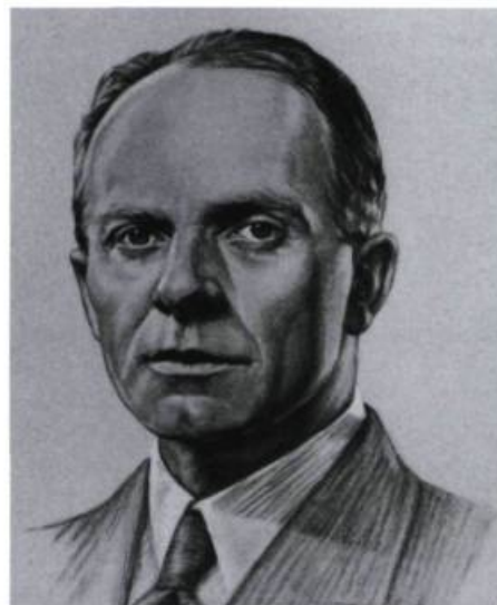
Traître ou patriote

Un bémol toutefois, Singer préfère ne pas trop s'étendre sur la psychologie des personnages (sauf en ce qui a trait à Wolverine, mentionné plus haut, ainsi qu'aux deux mutants rivaux, le professeur Xavier et Magneto, interprétés par Patrick Stewart et Ian McKellen, deux acteurs exceptionnels au sommet de leur forme,