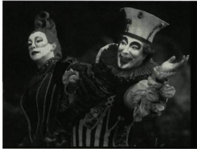
La rencontre des instincts clownesques