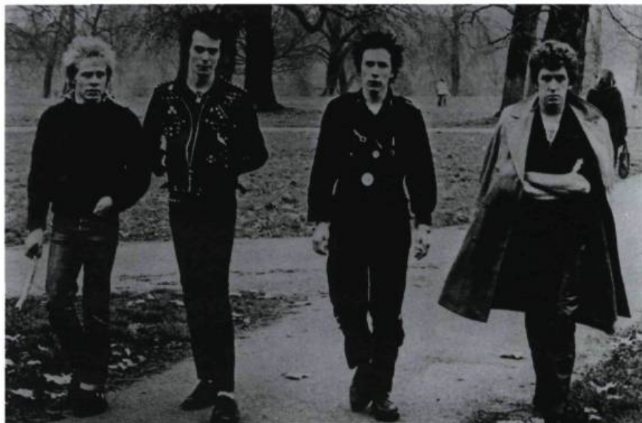
The Sex Pistols: The Filth and the Fury

Alors que la série des James Bond ne cesse d'agoniser et que l'inspecteur Harry a trouvé sa dernière cible il y a plus de quinze ans déjà, voilà que le détective privé John Shaft revient faire trembler les malfrats de