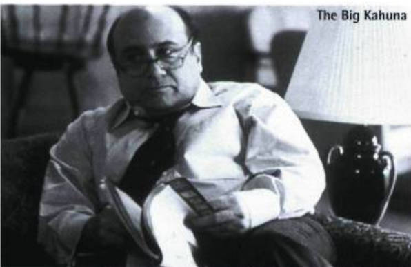
The Big Kahuna