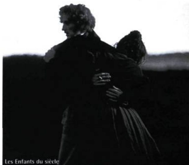
Les Enfants du siècle

Or, ce message utopique est malheureusement noyé par une réalisation saturée d'effets parfois complaisants et par un scénario qui veut beaucoup trop en dire à la fois. Entre manifeste à peine voilé contre la