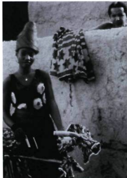
La Vie sur terre