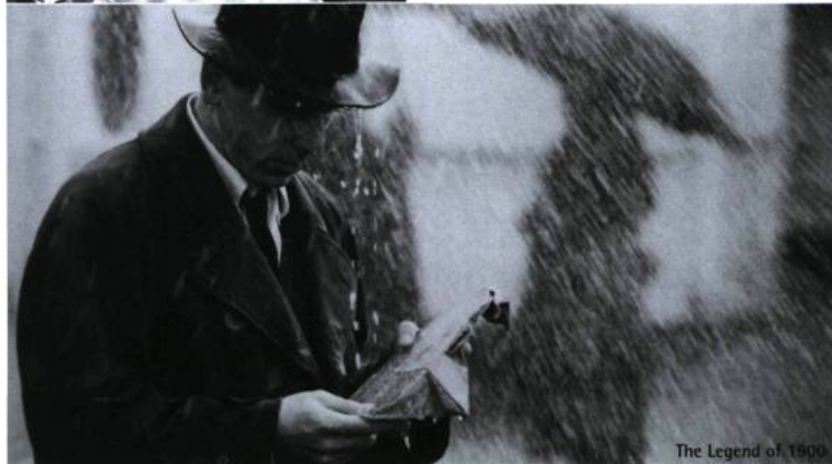
The Legend of 1900

En choisissant de centrer son récit sur le jeune New-Yorkais et les trois Canadiens qui tentent de faire libérer Carter — durant près de la moitié du film, à coup de séquences interminables —, Norman Jewison passe à côté de l'essentiel : « The Hurricane ». Film pseudo-biographique, The Hurricane entend plus se porter à la défense d'une cause (l'erreur judiciaire qui condamne des innocents à la prison) qu'à tracer le portrait d'un homme. Pire, en voulant se porter à la défense d'une noble cause, Jewison ignore complètement le vrai sujet de son film : le racisme. Pour traiter du racisme, il aurait fallu approfondir les motifs du policier véreux (fascinant personnage)! qui dévoue sa vie entière à s'acharner sur le sort du pauvre Carter.