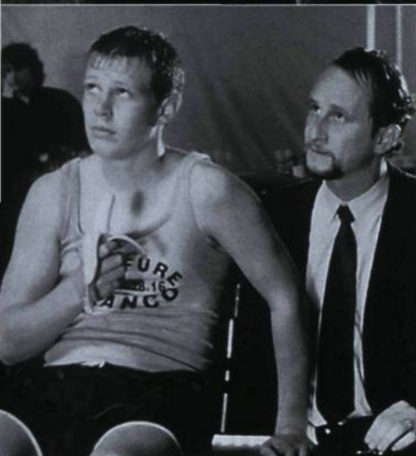
Les Convoyeurs attendent

des films fort divertissants, il reste que l'univers irvingien dans toute sa complexité est beaucoup moins évident à adapter avec justesse pour le grand écran qu'il n'y paraît de prime abord. Se cantonnant principalement dans ses aspects les plus fantasques, le World According to Garp , de George Roy Hill, tout comme l' Hotel New Hampshire , de Tony Richardson et, plus récemment, le Simon Birch , de Mark Steven Johnson, malgré d'évidentes qualités d'interprétations et une réalisation inventive, présentaient toutefois une vision relativement réductrice d'Irving en essayant d'embrasser trop de pistes en même temps.