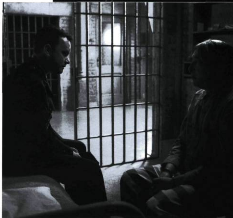
The Green Mile

peine de mort et hymne un peu mièvre sur la réconciliation entre les hommes, le film de Darabont semble hésiter entre les nombreuses voies qui s'offrent à lui. Et à force d'hésiter, The Green Mile finit par ne rien affirmer.