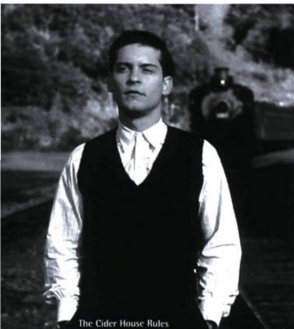
The Cider House Rules

Porté à l'écran par le Suédois Lasse Halström, un spécialiste des explorations de la nature humaine, The Cider House Rules est certainement la meilleure adaptation cinématographique d'un roman de John Irving. S'il est vrai que les récits foisonnants et les personnages colorés et peu conventionnels de l'auteur américain constituent matière de choix sur laquelle on peut bâtir