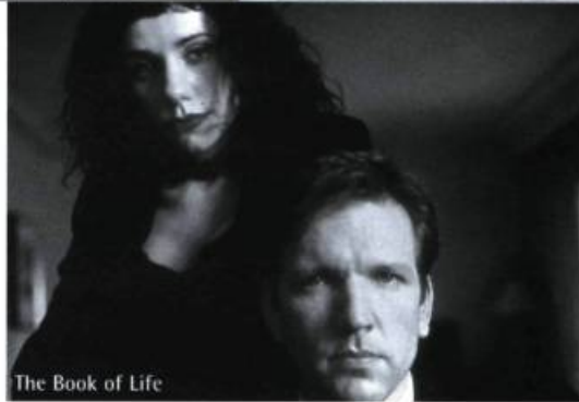
The Book of Life

réflexion qu'il suscite, formant une parfaite harmonie entre le visuel, le sonore et l'intellectuel, en quelque sorte une adéquate symétrie du regard.