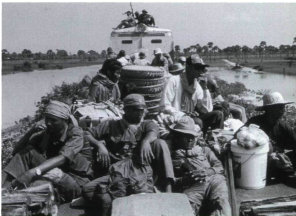
Un soir après la guerre