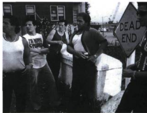
Summer of Sam

victimes féminines ont toutes les cheveux foncés. La paranoïa gagne rapidement le ghetto où, déjà, la tension entre les différentes minorités ethniques se coupe au couteau. Frustrés par la lenteur de l'enquête policière, surexcités par le cirque médiatique entourant les meurtres, les citoyens décident de prendre la justice en main et de former leur propre comité de surveillance. Même la mafia se met de la partie, offrant une récompense pour la tête du tueur. Au milieu de cette furie, un jeune coiffeur italo-américain, Vinny (John Leguizamo), se paie du bon temps à la discothèque du quartier, trompe sa petite amie Dionna (Mira Sorvino) avec ses copines et consomme alcool et cocaïne sans aucune retenue. Sa vie nocturne bouge au rythme ré-