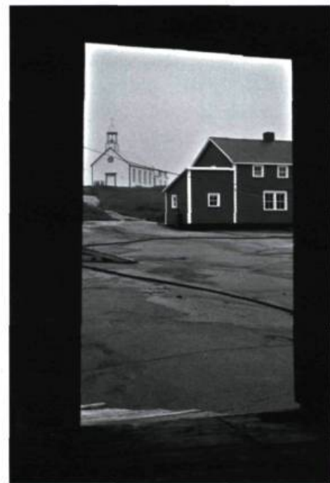
Avant le jour

Le mérite d' Avant le jour , c'est de voir s'exprimer ces hommes et ces femmes simples, sans passer par le truchement d'une fiction littéraire ou théâtrale. Ce qui étonne,