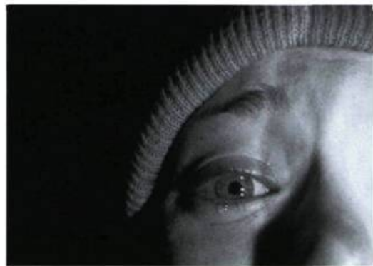
The Blair Witch Project

Informé dès le début du film de son issue inévitable, forcé de n'avoir à se mettre sous la dent que les images angoissantes filmées par les trois héros (et en fait réellement tournées à la manière d'un documentaire étudiant par les acteurs eux-mêmes), et donc ne disposant d'aucun élément extérieur lui laissant croire à un jeu de manipulation cinématographique