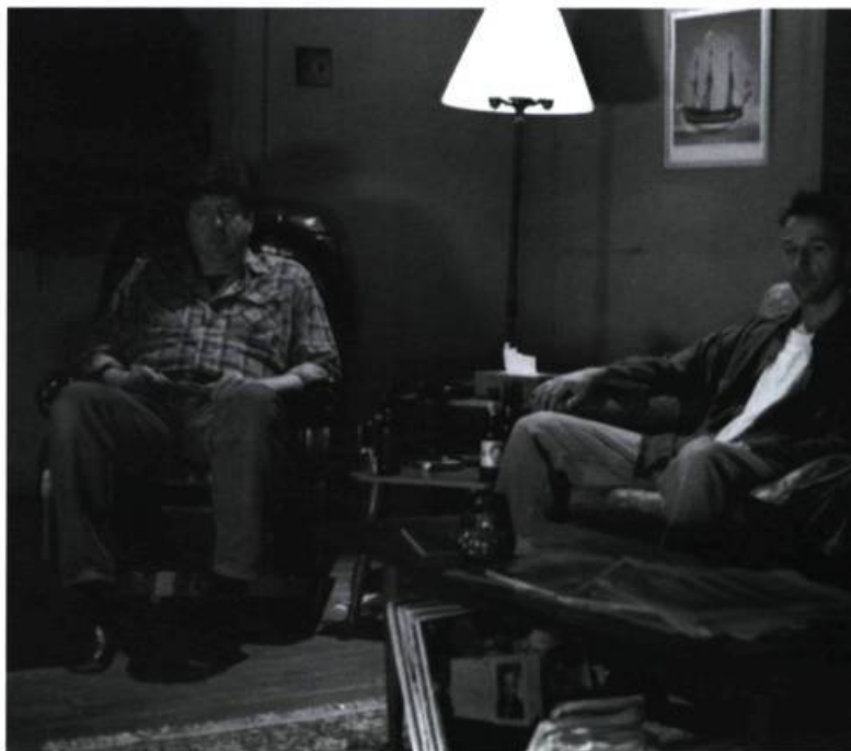
Les Fleurs magiques

The translators , de John Zeppetelli. Un film de style monté en vidéo et empruntant toutes les caractéristiques narratives propres au médium: superpositions, juxtaposition d'images, et décalage de la