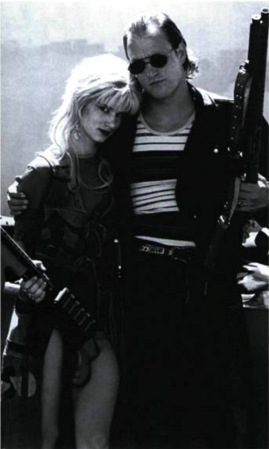
Natural Born Killers