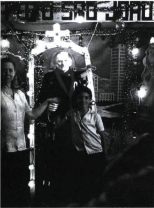
Central do Brasil

de violoncelle qu'elle a identifié comme étant celui qu'elle aimera, on ne peut, par la suite, que la suivre pas à pas, complice curieux et consentant de sa vie rêvée.