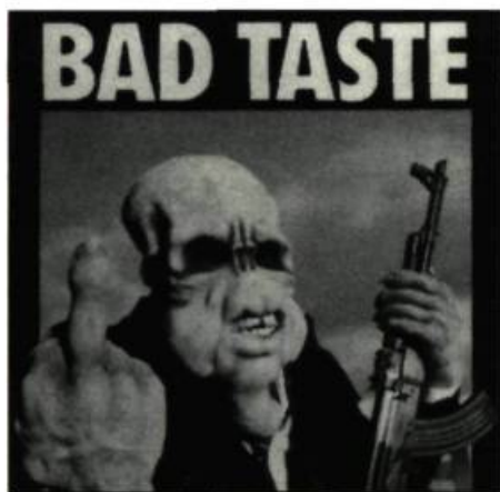
Une affiche qui veut tout dire

à l'avant-garde de la comédie-gore. En s'appropriant le ton absurde et surréaliste des Monty Python et le sens du gag visuel des films muets, le cinéaste a pondu un style unique qui transgresse les conventions de genre. Alors que d'autres cinéastes de comédie-gore s'appuient souvent sur la réflexion, la parodie et le camp , Jackson s'appuie quant à lui sur la structure du gag pour offrir un sous-texte comique à l'horreur dégoûtante. Dans une interview, le cinéaste a décrit ses films comme des œuvres de «splat-stick», un jeu de mots sur les termes «slapstick» (comédie physique) et «splatter» (éclaboussure de sang). Dans la mesure où la majorité des spectateurs associent le genre slapstick avec la comédie physique pure (Les Three Stooges, Mack Sennett), le terme employé par Jackson ne décrit pas parfaitement ses œuvres, car le cinéaste pratique une forme d'humour visuel qui s'élève au-dessus du simple slapstick.