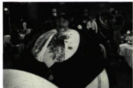
La grande bouffe de The Meaning of Life