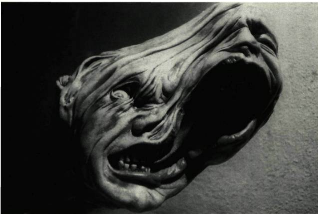
Le body horror de The Thing ...

Se déroulant en temps réel à l'écran, l'intérêt de ces mutations est en partie technologique, puisque le public s'étonne devant de tels effets [...] à l'instar du public qui, en 1890, allait au Grand Guignol parisien pour admirer les éentrations, égorgements et autres effets sanglants se déroulant sur scène.