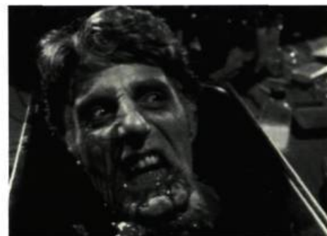
Un médecin qui perd la tête dans Re-Animator

Dans ce film, l'humour résulte de la tension nerveuse que provoque l'horreur. Evil Dead 2 , qui est plus un remake qu'une suite, ne se préoccupe plus de récit et de suspense. Le premier zombi y apparaît cinq minutes après le générique et c'est l'enfer (littéralement!) pour les 80 autres minutes qui se déroulent dans un climat d'hystérie, un rythme et un ton