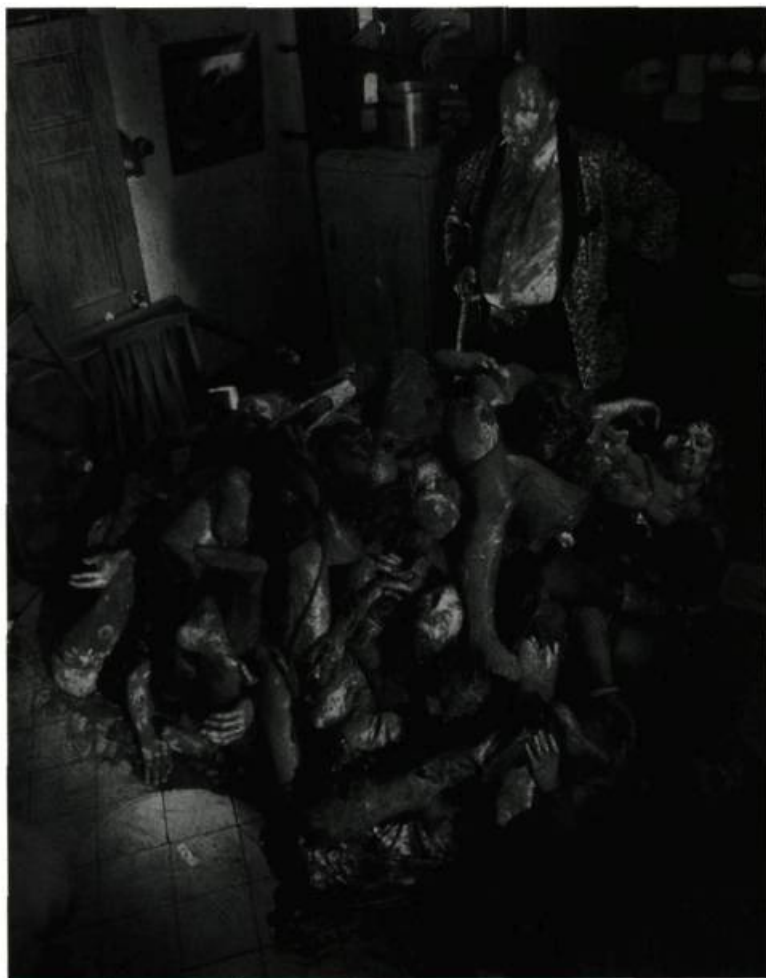
Le grand guignol de Braindead