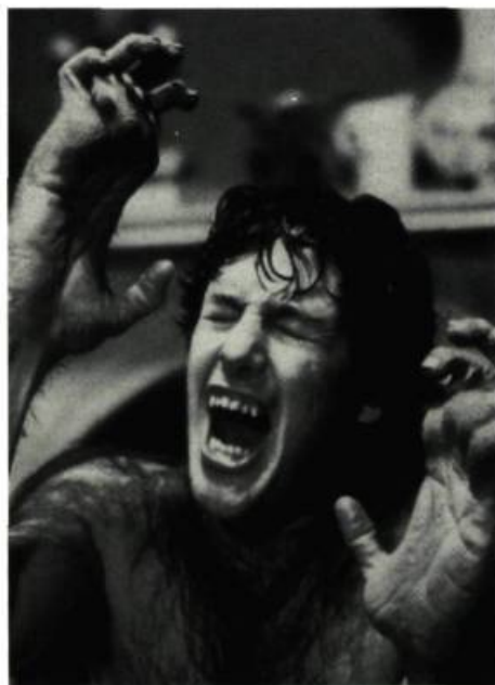
... et celui de An American Werewolf in London

Se déroulant en temps réel à l'écran, l'intérêt de ces mutations est en partie technologique, puisque le public s'étonne devant de tels effets [...] à l'instar du public qui, en 1890, allait au Grand Guignol parisien pour admirer les éentrations, égorgements et autres effets sanglants se déroulant sur scène.