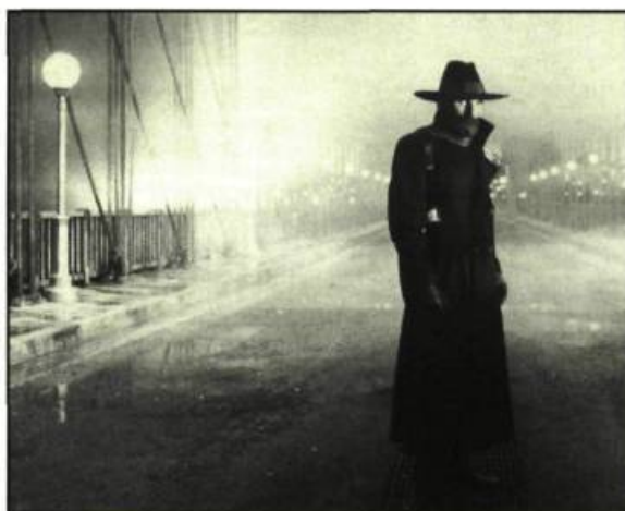
Alec Baldwin dans The Shadow

L'élégance exquise des décors art-déco, les contrastes raffinés de la photographie et le choix superbe des couleurs font de The Shadow un des plus beaux films d'aventures fantastiques jamais