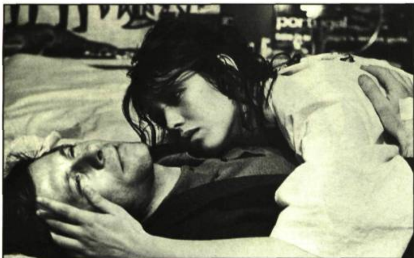
Adjani avec Roman Polanski dans Le Locataire