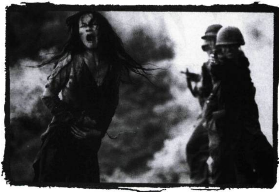
Casualties of War

Il n'est pas nécessaire de reprendre ici l'infini répertoire d'arguments pour ou contre la violence dans les films. Soulignons simplement que la violence existe dans la société, donc elle ne peut que se refléter dans l'expression artistique qui, par définition, s'interroge sur le fonctionnement de cette même société. Cependant, il arrive très souvent qu'au cinéma, particulièrement dans le cinéma commercial américain, la violence ne soit employée que de façon gratuite, dans un but d'exploitation systématique de puérils frissons garantis ou argent remis (les «cheap thrills»). Prenons en exemple certains slashers comme la série des Friday The 13th ou les derniers épisodes des Nightmare on Elm Street . La violence y est gratuite parce qu'elle n'est pas le résultat d'une progression dramatique issue du conflit généré par l'antagonisme des personnages. Elle n'est pas non plus déclenchée par les motivations profondes de ces personnages. Le spectateur n'est pas associé ou impliqué directement par cette violence. Il ne fait que la contempler passivement, y retirant un plaisir momentané et vite oublié, qui provient uniquement des variations sur les manières de tuer (démembrement, décapitation, empalement et autres délectables massacres...). Outre leur refus ou leur incapacité à toucher émotionnellement le spectateur, ces films deviennent souvent misogynes et racistes, procurant tout au plus à l'audience le sentiment cathartique d'avoir