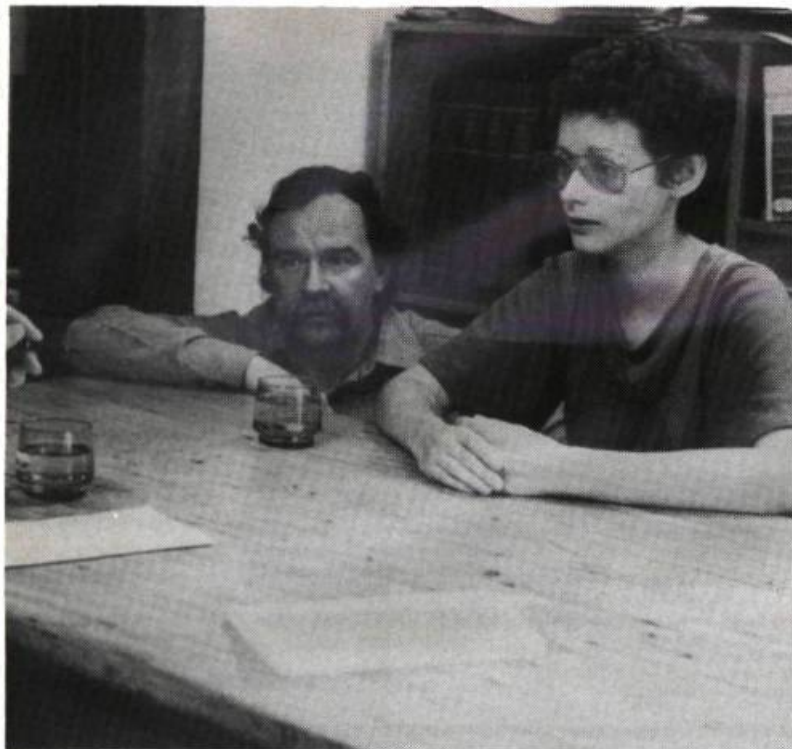
Photo de tournage de Marie Uguay